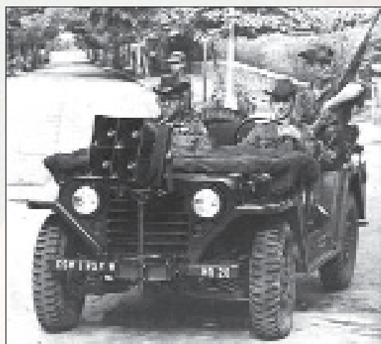
■ Dominikanski lojalisti

domaće i vanjske politike. Sovjetski Savez i Kuba osudili su američki angažman u Dominikanskoj Republici, a kao najveći dobitnik događaja vjerojatno je izašao Fidel Castro koji je, premda nije imao izravne veze sa zbivanjima na susjednom karipskom otoku, dobio znatne