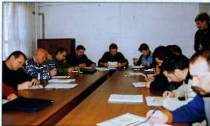
■ Kroz tranzicijske radionice prošlo je oko 1100 izdvojenih osoba

Programom informacija o obrtu, malom i srednjem poduzetništvu, a koji se provodi u suradnji s Ministarstvom gospodarstva, rada i poduzetništva koristio veliki broj onih koji su se odlučili za samozapošljavanje preko savjetovanja u odsjecima za tranziciju. Program savjeto-