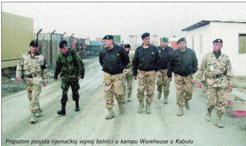
Prigodom posjeta njemačkoj vojnoj bolnici u kampu Warehouse u Kabulu