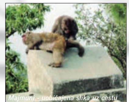
Majmuni - uobičajena slika uz cestu

oprežno naokolo, a indijski stražari vas mlako pokušaju zaustaviti, natrčat ćete ravno na dvostruku žičanu ogradu visoku oko 2,5 metra. Baksuz kakav jesam, tu su me strpali samog, čučim po cijeli dan u mračnom uredu i prenosim radioporuke. Već se vidim na centrali kad se vratim kući. Kad nisu uključeni generatori, napon gradske struje je tako slab, kada je uopće ima, da žarulja svijetli kao svijeća, a nema šanse da električna grijalica radi. S obzirom na to da je dnevna temperatura sada koncem prosinca plus trideset, a noćna ispod nule, kao svi stari ljudi koji ne nose duge gaće i