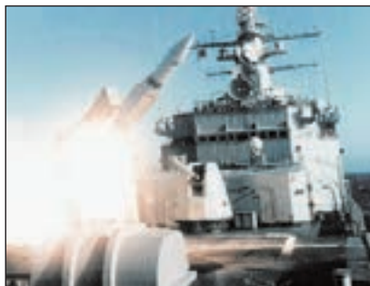
■ Nuklearne krstarice klase California bile su naoružane raketnim protuzračnim sustavom Standard MR

Osnovna zamisao bila je napraviti velike višenamjenske ratne brodove čija će osnovna namjena biti eskortna pratnja velikih nuklearnih nosača zrakoplova. Zbog toga su plani-