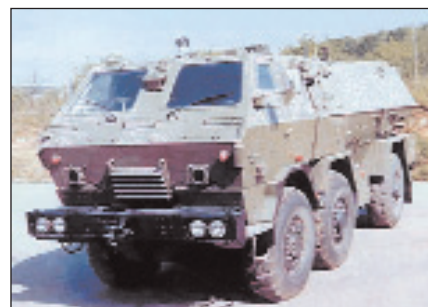
■ Slovački TATRAPAN je našao ograničenu primjenu u inačicama zapovjednog i ambulantskog vozila

stavljanje oklopa i većeg stupnja zaštite od teških strojnica, ali to znači bitno povećanje mase samog vozila sa svim nedostacima koji idu uz to. Kod postavljanja protuminske zaštite osnovni problem proizlazi iz toga