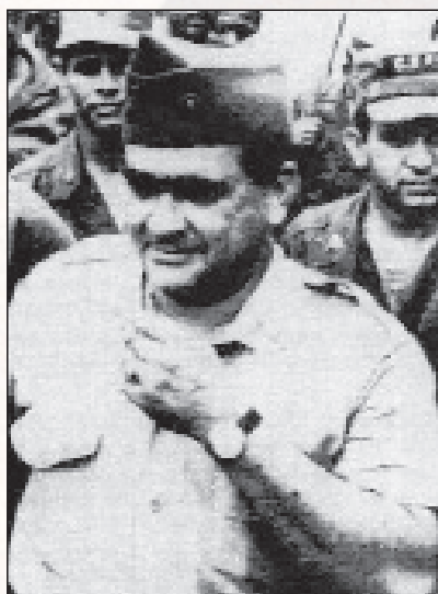
■ General Trujillo je dugo vremena vladao Dominikanskom Republikom

nikanskoj Republici, američki je predsjednik Johnson 27. travnja 1965. objavio početak operacije "Power Pack". Operacija je predviđala slanje četiri stotine marinaca koji su trebali uspostaviti red na otoku i organizirati evakuaciju američkih državljana te raspoređivanje velike američke flote od četrdesetak brodova radi potpune pomorske blokade otoka. Pod snažnim američkim utjecajem Organizacija američkih država (OAS) donijela je odluku o sastavljanju mirovnih snaga s američkog kontinenta. U međuvremenu su 29. travnja Sjedinjene Države poslale 2200 padobranaca iz 82. zračnodessantne divizije za kojima su sljedećih dana stigli i dijelovi 11. zračne divizije te 6. marinskog ekspedicijskog korpusa, tako da se prvih dana svibnja u Dominikanskoj Republici nalazilo dvadeset i tri tisuće američkih vojnika.