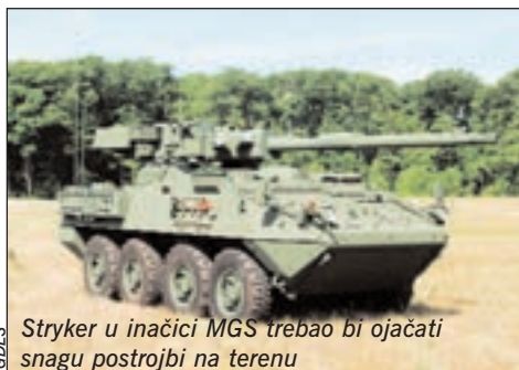
Stryker u inačici MGS trebao bi ojačati snagu postrojbi na terenu

Tekst u cijelosti pročitajte na: www.hrvatski-vojnici.hr