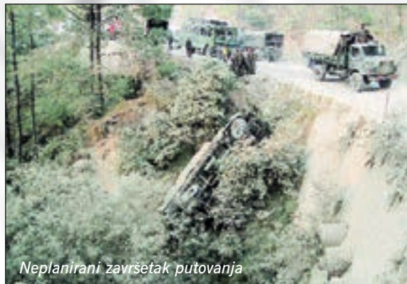
Neplanirani završetak putovanja