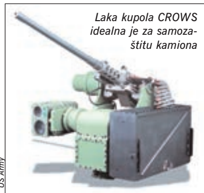
Laka kupola CROWS idealna je za samozastitu kamiona

teže postaviti ravne oklopne ploče. Sada se više pazi da vojni kamioni imaju i vojne kabine ravnih površina te mogu primiti oklopne ploče do III. stupnja zaštite prema NATO STANAG standardu (zaštita od metka 7.62 x 54 mm ispaljenog s udaljenosti od 30 m). Moguće je po-