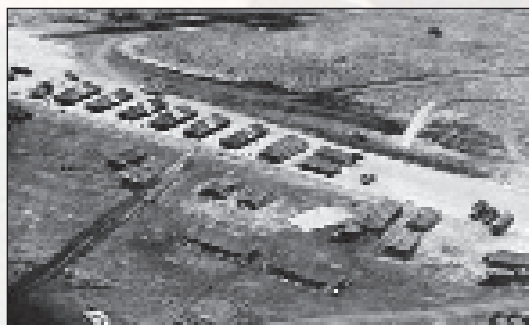
■ Američki vojni logor blizu aerodroma San Domingo

U borbama je poginulo oko tri tisuće građana Dominikanske Republike te dvadeset i četiri američka vojnika, a oko 150 Amerikanaca je ranjeno. Američka intervencija u suverenoj državi stajala je prestiža predsjednika Johnsona na području