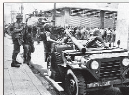
■ Američki vojnici u San Domingu

Sjedinjene Države bojale su se da će takav razvoj događaja Dominikansku Republiku pretvoriti u još jednu Kubu na latinskoameričkom kontinentu. Pripremajući teren za invaziju, Washington je optužio pobunjenike da ih predvodi skupina kubanskih pristaša, iako za to nije bilo dokaza. Pravdajući se potrebom zaštite američkih građana u Domi-