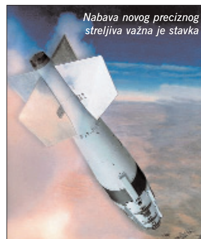
Nabava novog preciznog streljiva važna je stavka

U planiranju izdataka za nabavu administracija predsjednika Busha je većim dijelom nastavila započete programe prošle administracije dok je samo nekoliko projekata otkazano. Projekcije Ureda za proračun američkog Kongresa (CBO) koje se odnose na planove modernizacije predviđaju dugoročni porast izdataka za nabave koji bi od 2010. od 2020. trebali u prosjeku iznositi 110 do 135 mlrd. USD (izraženo u stalnim USD iz 2005.). Prema istom izvoru vrhunac izdataka za investicije koje u ter-