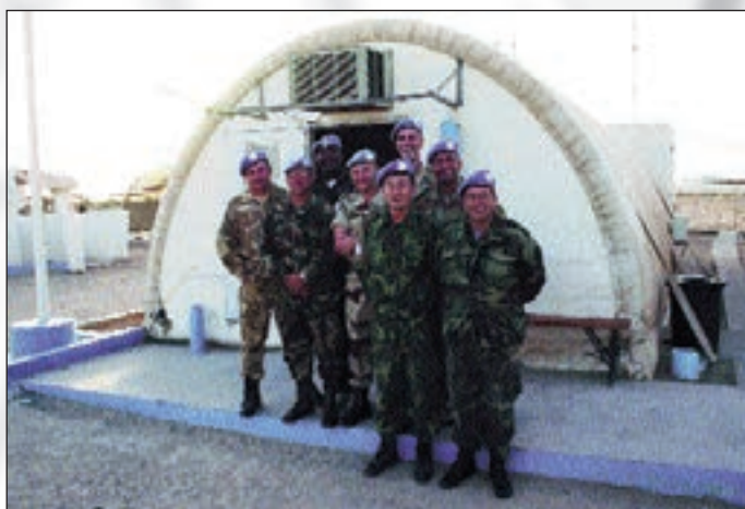
■ Srdačan doček na TS-u Mijek

smo dobili svoje vozačke dozvole. Nakon svih brifiranja i papirologije, primio nas je mađarski general Gyorgy Szaraz, zapovjednik vojnog dijela misije. U kratkom razgovoru, istaknuo je kako je izrazito zadovoljan radom svih dosadašnjih hrvatskih promatrača te nam je poželio sreću i uspjeh u radu. Zadnju večer