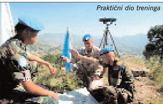
Praktični dio treninga

Stoga je UN Military Observers konferencija vrhunac treninga i mjesto stjecanja vrlo vrijednih spoznaja koje se sada, nakon prijašnjih treninga, te praktičnog rada u postajama pretaču u naučene lekcije. Ona je mjesto na kojem možeš čuti mnogo važnih stvari i na kojoj svaki pojedinac ima pravo aktivno sudjelovati, pitati, predložiti, a najvažnije je, naravno, da će na kraju svi sigurno, bez imalo sumnje, mnogo toga naučiti... ■