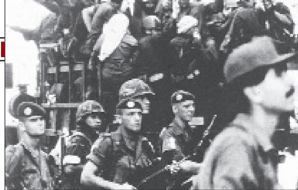
■ Američki i francuski vojnici nadgledaju evakuaciju boraca PLO-a iz Beiruta

Izraelska opsada Beiruta je i u vojnom i u političkom smislu bila uspjeh. Iako PLO nije bio vojno uništen, njegova evakuacija je znatno oslabila pri-