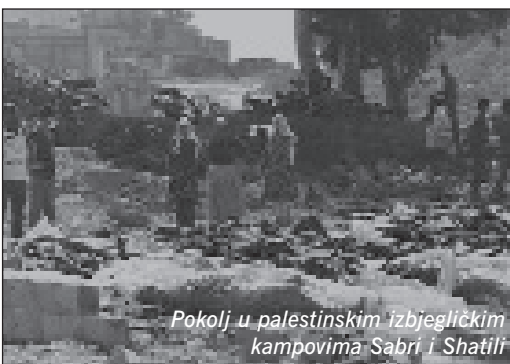
Pokolj u palestinskim izbjegličkim kampovima Sabra i Shatila

Tekst u cijelosti pročitajte na: www.hrvatski-vojniki.hr