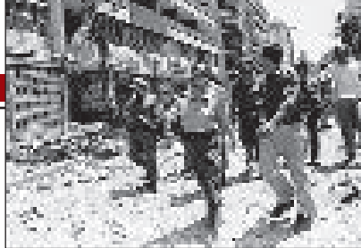
■ Arafat u obilasku pogođenog sveučilišta, 2. kolovoza 1982.

štenih oklopnih vozila. Naime, Izraelci nisu bili pripremljeni za urbano ratovanje jer je većina izraelskih postrojbi pred Beirutom bila oklopna ili mehanizirana, s malim brojem klasičnih pješadijskih postrojbi. Izravni napad na grad u pravilu je implicirao i velike izraelske vojne žrtve, koje bi izraelska javnost i birači teško prihvatili. Osim toga, izraelsko je vodstvo bilo svjesno da vojno zaposjedanje glavnoga grada jedne arapske države nosi i krupne političke posljedice, a protezanje opsade na dugo razdoblje će donijeti palestinskom pitanju neželjenu pozornost u inozemstvu. Izraelska vojska je kontinuirano držala zapadni Beirut pod snažnom zračnom, pomorskom i topničkom vatrom. U više navrata pokušani su atentati na palestinske dužnosnike preciznim bombardiranjem iz zraka. Tako su u više navrata Yasser Arafat i nekoliko njegovih najbližih suradnika bili mete izraelskih bombi, koje su izbjegli za samo nekoliko minuta. Iako je PLO pretrpio velike žrtve tijekom opsade i bio u znatnoj mjeri oslabljen napadima, politička šteta u međunarodnoj zajednici nanosena Izraelu bila je daleko veća od dobitka koju je ostvario opsadom Beiruta. Izraelske granate su ubile velik broj civila koji nisu imali veze s PLO-om, zbog čega je Tel Aviv trpio velike kritike u inozemstvu.