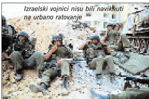
Izraelski vojnici nisu bili naviknuti na urbano ratovanje

Izraelska je vojska 13. srpnja izvela probni napad na beirutsku zračnu luku, koji je bio odbijen uz nekoliko uni-