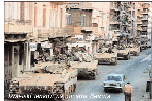
Izraelski tenkovi na ulicama Beiruta

Izraelske snage su 13. lipnja 1982. stigle do Beiruta i zauzele istočno predgrađe Baabdu. Od 14. lipnja počele su borbe za zauzimanje uzvisina iznad grada, koje su potrajale do 26.