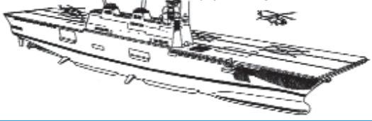
Odabrana inačica japanskog DDH razarača

Tekst u cijelosti pročitajte na: www.hrvatski-vojniki.hr