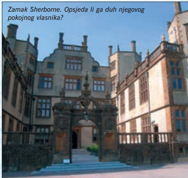
Zamak Sherborne. Opsjeda li ga duh njegovog pokojnog vlasnika?

je za sudioništvo u uroti iskovanoj protiv njega i bacio u londonski Tower u kojem je čamio duže od deset godina. Kao utamničnik, Raleigh je napisao mnoga svoja djela, među njima i prvi dio svoje Povijesti svijeta. Pušten na slobodu, sudjelovao je opet u borbama protiv Španjolaca, s kojima su Englezi tad već željeli uspostaviti mir. Španjolski veleposlanik Diego Sarmiento de Acuña zatražio je od Jamesa I. da Raleigha osudi na smrtnu kaznu i 29. listopada 1618. u Whitehallu bila mu je odrubljena glava. Posljednje riječi na smrt osuđenoga bile su: „Sjekira je oštar lijek, ali liječi sve bolesti!“ ■