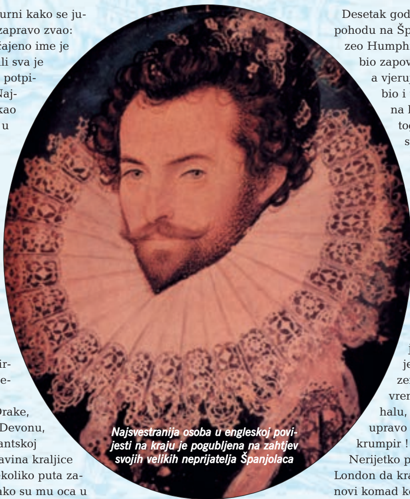
Najsvestranija osoba u engleskoj povijesti na kraju je pogubljena na zahtjev svojih velikih neprijatelja Španjolaca

Baš kao i Francis Drake, i Raleigh se rodio u Devonu, ali u izrazito protestantskoj obitelji, kojoj je vladavina kraljice Mary I. Engleske nekoliko puta zamalo došla glave. Kako su mu oca u nekoliko navrata htjeli ubiti, Raleigh je zarana zamrzio katoličanstvo i to počeo iskazivati čim se godine 1558. na prijestolje uspela protestantska kraljica Elizabeta I. Ne zna se mnogo o njegovu životu u mladenačkoj dobi, ali gotovo je sigurno da je u službi francuskih hugenota sudjelovao u bitki kod Jarnaca. A bio je to sukob koji se u sklopu tzv. francuskih vjerskih ratova dogodio 13. ožujka 1569. kad su se katoličke snage maršala Gaspar-