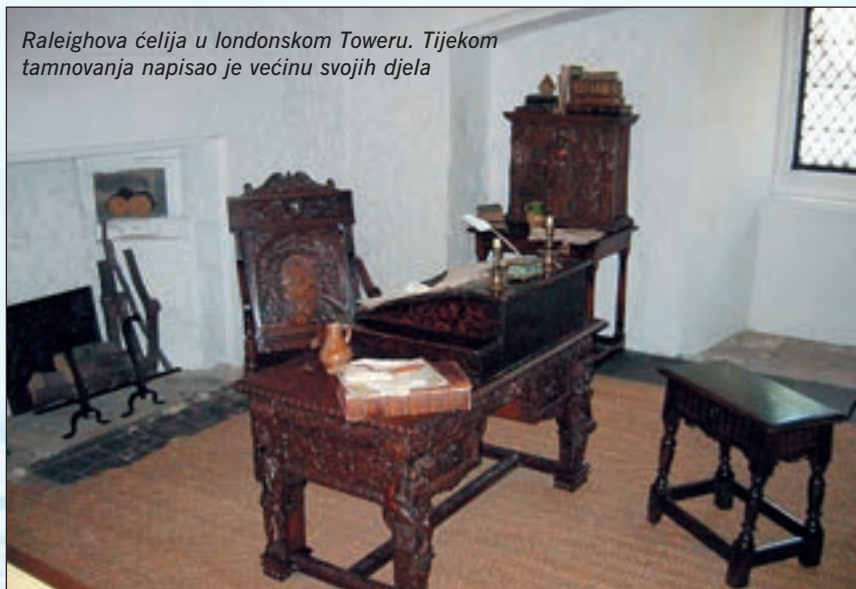
Raleighova ćelija u londonskom Toweru. Tijekom tamnovanja napisao je većinu svojih djela

plijena sa španjolskog broda Madre de Dios.