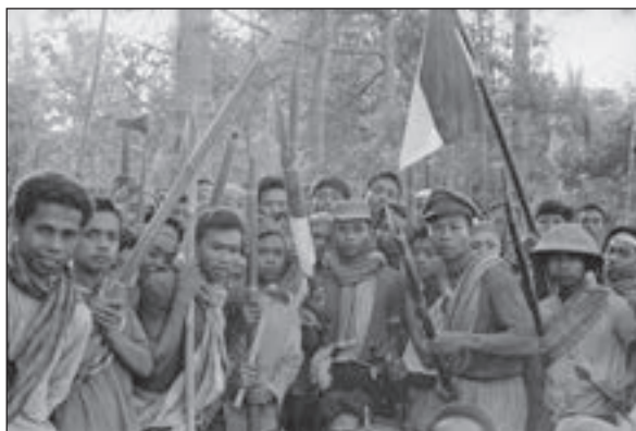
■ Velik dio zločina počinile su naoružane bande islamista

Do početka 1965. godine indonezijsko je društvo postalo opasna mješavina socijalnih i političkih tenzija kojoj je samo trebao povod za eksploziju. Tada je 30. rujna 1965. skupina lijevo orijentiranih časnika pod zapovijedanjem pukovnika Untunga, Subandria i Nyonia (kasnije prozvanih skupina "30. rujna") pokušala vojni udar. U noći prevrata oteto je nekoliko visokih