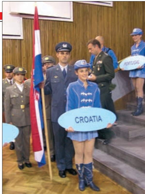
■ Hrvatski predstavnici na svečanosti zatvaranja 40. svjetskog vojnog prvenstva

Na prošlogodišnjem vojnom SP-u osvojio sam tri medalje, a ovaj put četiri. To je jedan od najboljih rezultata u mojoj karijeri. Uz to, sjajan je osjećaj pobijediti Guergioua, ove sezone gotovo nepobjedivog. "Duga" utrka za mene je bila gotovo savršena, nisam činio pogreške i izvrsno sam se osjećao. Ipak, poseban osjećaj je pobijediti s momčadi, te pobjede važne su upravo na vojnim natjecanjima, čija je razina vrlo visoka. U vojnoj konkurenciji nedostaju vrhunski civilni natjecatelji iz skandinavskih zemalja.