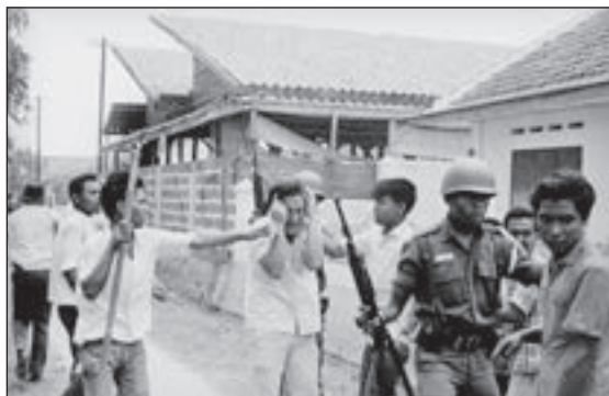
■ Progonom je djelomično bila obuhvaćena i kineska zajednica u Indoneziji

U pojedinim dijelovima Indonezije ubojstva su bila do te