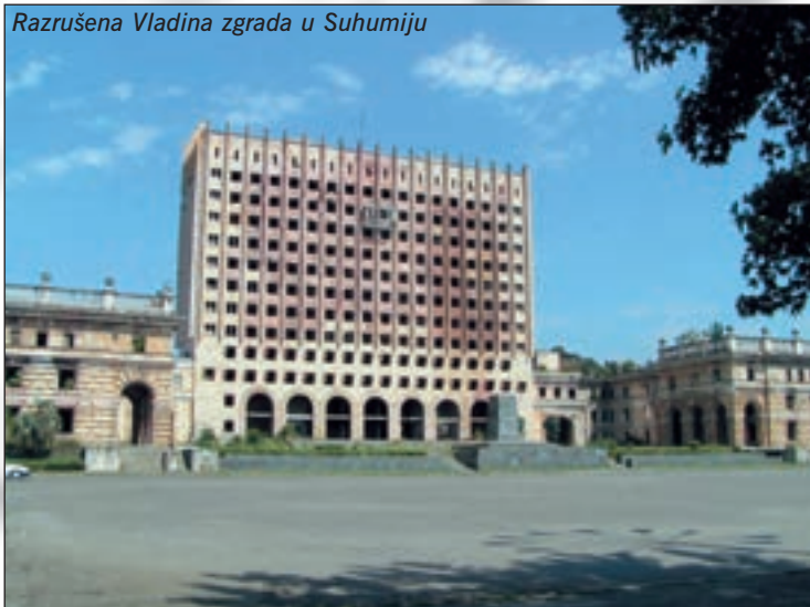
Razrušena Vladina zgrada u Suhumiju