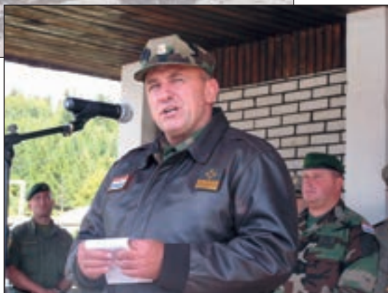
■ Danas je cilj ove postrojbe uvježbavati se za sve moguće ugroze kako bi bila spremna osigurati život, miran i bez straha, za sve naše građane, kazao je general Lucić