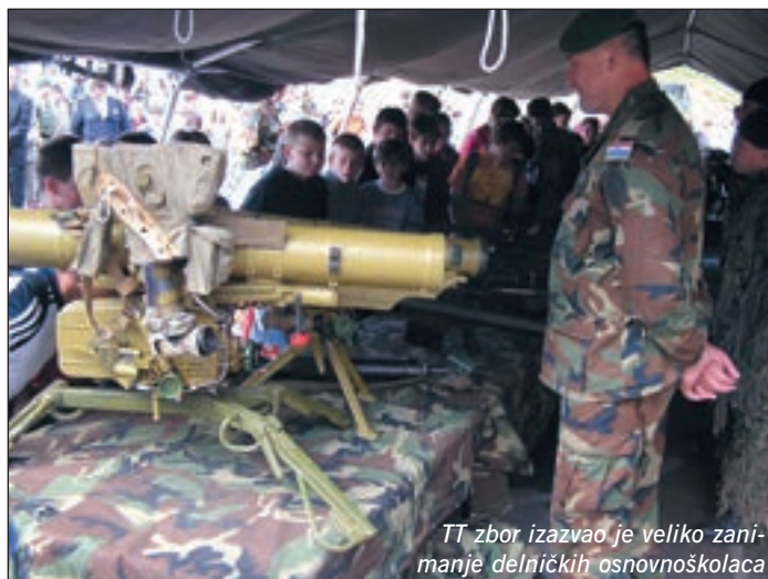
■ TT zbor izazvao je veliko zanimanje delničkih osnovnoškolaca