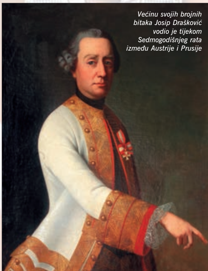
Većinu svojih brojnih bitaka Josip Drašković vodio je tijekom Sedmogodišnjeg rata između Austrije i Prusije

U Sedmogodišnjem ratu (1756.-1763.) prvo se istaknuo u bici kod Lobositz-a 1. listopada 1756. kamo je, kako bi spriječio austrijski pokušaj deblokade opkoljene saske vojske kod Pirne, pruski kralj Fridrik II. poslao dio pruskih snaga ususret Austrijancima. Austrijski maršal Browne zauzeo je povoljan položaj s glavninom vojske. Na desnom krilu uzduž rijeke Elbe bila je postavljena jaka prethodnica koja je podupirala četiri bojne karlovačkih i banskih krajišnika pod zapovjedništvom generala Draškovića izbočene ispred desnog krila. Krajišnici su bili smješteni na padinama brijega Lobosch, a zadaća im je bila omesti dolazak i razvoj Prusa. Fridrik je isprva mislio boriti se s austrijskom zalaznicom, pa je poslao