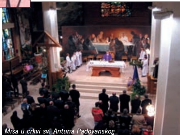
Misa u crkvi sv. Antuna Padovanskog

U spomen na nebeske vitezove slavonske ravni kod spomenika na središnjem trgu okupili su se brojni mještani općine Otok, a polaganjem vijenaca i paljenjem svijeća počast