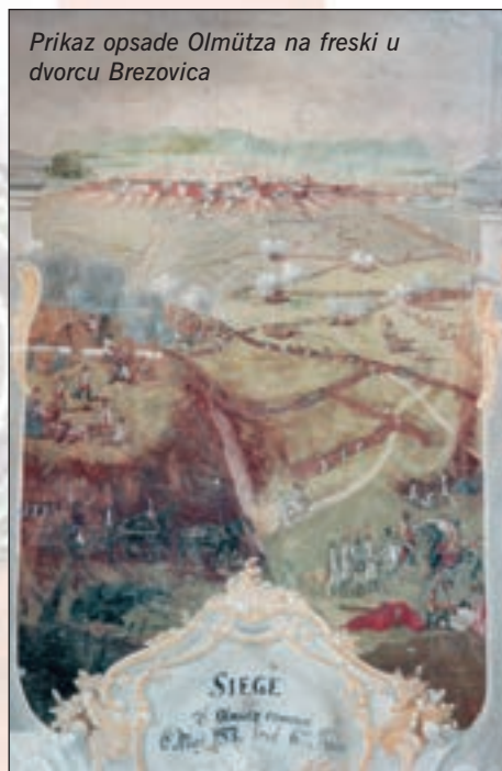
Prikaz opsade Olmütza na freski u dvorcu Brezovica

grenadiri i dragovoljci koji su ih prisilili na daljnje povlačenje dublje u tvrđavu. Za njima je Laudon odmah uputio jednu bojnu i uskoro je čitava utvrda bila zauzeta.