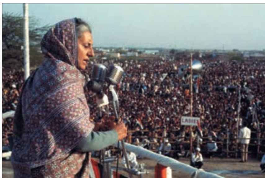
■ Indira Gandhi se obraća mnoštvu

Ubojstvo indijske državnice Indire Gandhi u listopadu 1984. godine uvelike se odrazilo na indijsku i svjetsku politiku osamdesetih godina. Zbog vala sektaškog nasilja nad Sikhima, koji je uslijedio nakon njezine smrti, atentat je imao vjerojatno najteže izravne posljedice od svih suvremenih atentata. Indijska političarka i premijerka Indira Priyadarshini Gandhi kći je prvoga indijskog premijera Jawaharlala Nehrua i unuka istaknutoga nacionalnog lidera Motilala Nehrua. Rođena je 1917. u gradu Allahabadu te je, za razliku od većine onodobnih indijskih djevojaka, dobila priliku studirati na sveučilištu Visva-Bharati, a potom i na uglednom Oxfordu u Velikoj Britaniji. Nakon povratka u domovinu, godine 1938., postaje člani-