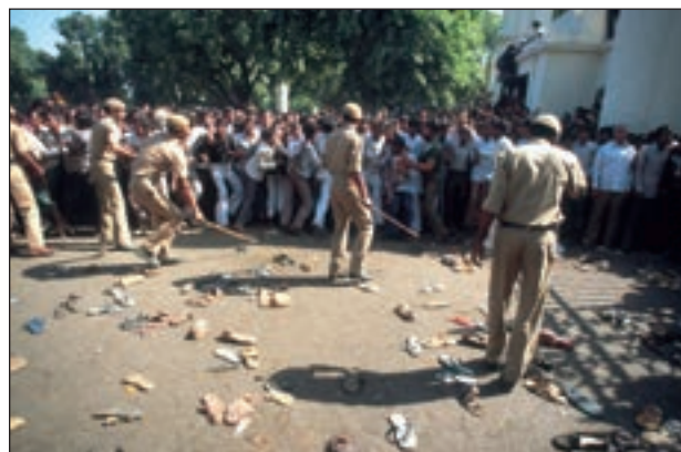
■ Napadi na Sikhe nakon atentata

Nakon što su indijske snage sigurnosti nekoliko mjeseci tolerirale militante, u svibnju 1984. Indira Gandhi je donijela odluku o uspostavljanju reda i početku vojne akcije u Zlatnom hramu pod nazivom Plava zvijezda. U okršaju je, prema indijskim izvorima, poginulo 497 Sikha unutar hrama te 83 indijska vojnika, no prema neovisnim izvorima broj poginulih u hramu bio je još mnogo veći, uključujući i brojne hodočasnike stradale u unakrsnoj vatri. Događaji su do-