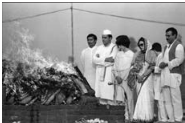
■ Po tradicionalnom indijskom običaju, Indira Gandhi je kremirana, a na posljednjem ispraćaju, uz članove obitelji i mnoštvo Indijaca, bili su i brojni svjetski državnici

Po tradicionalnom indijskom običaju, Indira Gandhi je kremirana 3. studenoga 1984. kraj Raj Ghata, u ceremoniji na kojoj su bili brojni svjetski državnici. Nakon njezine smrti, u New Delhiju i nizu drugih indijskih gradova izbio je masovno nasilje, u kojemu je ubijeno blizu