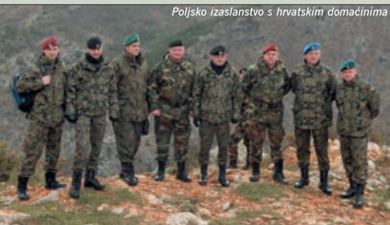
Poljsko izaslanstvo s hrvatskim domaćinima

— Leida PARLOV —