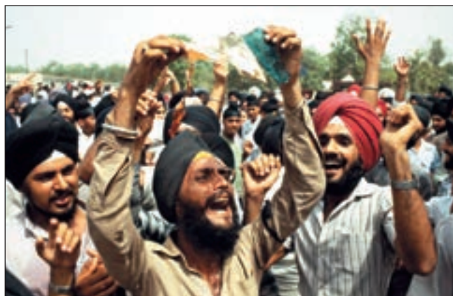
■ Prosvjedi Sikha nakon napada indijske vojske na Zlatni hram

Uz potporu snažne političke figure Kongresne stranke Kamaraja Kumarasamija, Indira Gandhi je nastavila politički uspon i nakon očeve