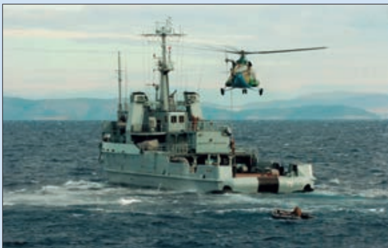
■ Brod obalne straže RH SB-73 "Faust Vrančić" na vježbi prekrcajanja tima za pregled sumnjivog tereta

Tijekom razgovora predstavnici Obalne straže Talijanske Republike dali su nekoliko savjeta i prijedloga, npr. da se lučke kapetanije i pomorska policija čvršće integriraju u sustav Obalne straže. Posebice je istaknuta mogućnost komuniciranja s medijima za sve pripadnike Obalne straže, što je i temeljna razlika u odnosu na ostale pripadnike Ratne mornarice. Časnici Obalne straže dužni su i mogu u svakom trenutku komunicirati s medijima u skladu s prirodom zadataka jer je potrebno proaktivno medijski djelovati. Na kraju razgovora predložen je i Plan zajedničke suradnje za 2009. godinu. ■