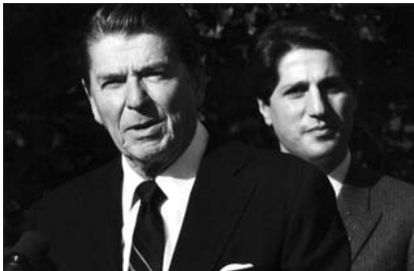
■ Gemayel je bio uzdanica Zapada - na slici u društvu s američkim predsjednikom Reaganom

Dana 14. rujna 1982. Gemayel je trebao održati govor u sjedištu falangista u bejrutskoj četvrti Achrafieh. Osobno osiguranje preporučivalo je Gemayelu da iz sigurnosnih razloga izbjegava rutinu i ranije najavljene skupove. Naime, politički atentati su u to vrijeme bili gotovo svakodnevna pojava u Libanonu te su i Bashir Gemayel i njegov otac Pierre u više navrata bili meta, a u jednom od pokušaja atentata na Bashira ubijena je njegova kći. No, Gemayel se ipak odlučio pojaviti na skupu u stranačkom sjedištu jer je to bila posljednja prilika da se obrati stranačkom vodstvu prije preuzimanja predsjedničke dužnosti i zahvali na političkoj potpori u posljednjih deset godina.