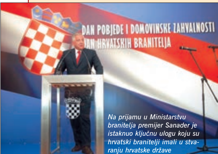
Na prijemu u Ministarstvu branitelja premijer Sanader je istaknuo ključnu ulogu koju su hrvatski branitelji imali u stvaranju hrvatske države

Od ove godine 5. kolovoza, Dan pobjede i domovinske zahvalnosti, službeno je i Dan hrvatskih branitelja, koji će se ubuduće i tradicionalno obilježavati. Svojevrsni uvod u proslavu Dana branitelja upriličen je 4. kolovoza u Zagrebu, u prostorijama Ministarstva obitelji, branitelja i međugeneracijske solidarnosti. Predsjednik Vlade Republike Hrvatske dr. Ivo Sanader bio je domaćin svečanog prijama, kojem su nazo-