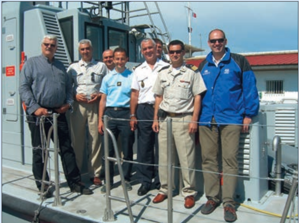
■ Hrvatsko izaslanstvo, u čijem su sastavu bili predstavnici Obalne straže RH, Lučke kapetanije Split, Pomorske policije Zadar i Carinarnice Rijeka, s pripadnicima francuske pomorske žandarmerije nakon plovidbe ophodnim brodom u akvatoriju luke Marseille

Od specijalističkih obuka, Obalna straža Talijanske Republike organizira obuku za pilote zrakoplova i helikoptera. Svake godine devet pilota odlazi na obuku u SAD, a šest ih se obučava u Italiji. Također se organizira i Tečaj za nadzor pomorskog prometa (VTS - Vessel Traffic System), i to sedam tečajeva na godinu za stjecanje zvanja VTS-operator. Nova škola za operativne poslove talijanske Obalne straže bit će osnovana u Messini tijekom 2008. ili 2009. Odjel sigurnosti na moru svake godine održava 20-ak tečajeva sigurnosti na moru u Genovi. Svake godine 19 časnika i dočasnika Obalne straže