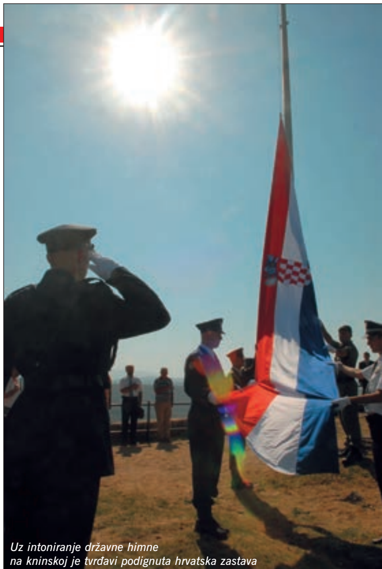
Uz intoniranje državne himne na kninskoj je tvrđavi podignuta hrvatska zastava

drugih događanja. Između ostalih, na kninskoj je tvrđavi postavljena izložba znakovlja i opreme obavještajne zajednice u Republici Hrvatskoj te izložba znakovlja Hrvatske vojske iz Domovinskog rata, a predstavljen je i zbornik radova Oluja 1995.-2005. Uz to, i ove su godine na glavnom gradskom trgu Kninjani i svi oni koji su posjetili Knin u informativnim šatorima mogli dobiti niz korisnih informacija o NATO-u, EU-u, programu Kadet te o projektu dragovoljnog služenja vojnog roka. ■