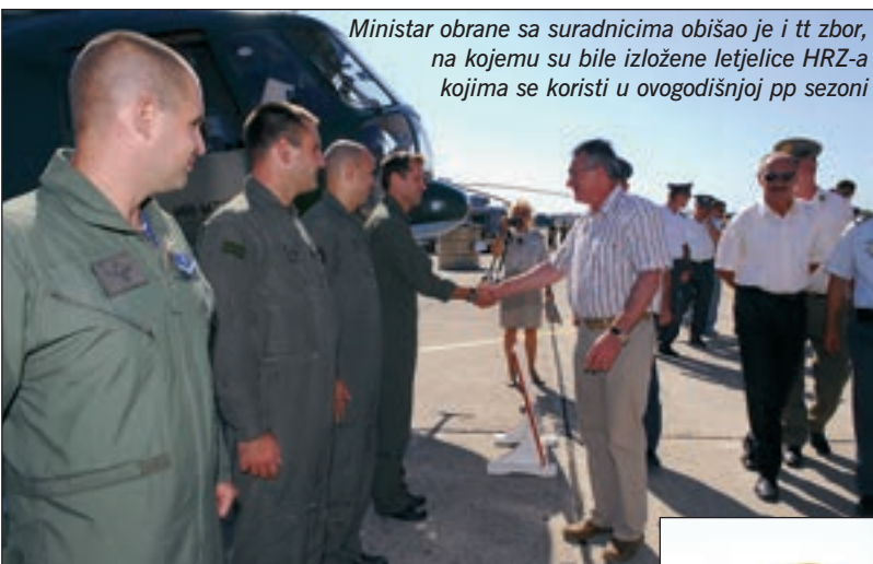
Ministar obrane sa suradnicima obišao je i tt zbor, na kojemu su bile izložene letjelice HRZ-a kojima se koristi u ovogodišnjoj pp sezoni

vrlo brzo ugašeni i mislim da Hrvatska doista danas ima čime gasiti požare", rekao je. Ministar je također najavio da se priprema poseban paket stimulativnih mjera kako bi se privuklo više mladih ljudi za poziv pilota. Jedna u nizu poticajnih