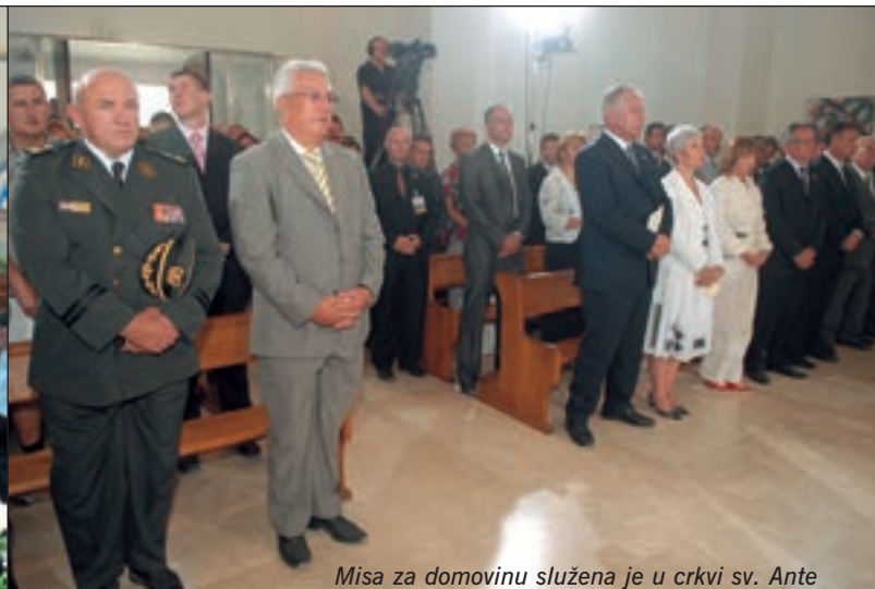
Misa za domovinu služena je u crkvi sv. Ante

stvene operacije Oluja, s ponosom treba isticati da su hrvatski vojnici i pripadnici MUP-a tom prigodom oslobodili domovinu i očuvali hrvatsku neovisnost. Istaknuo je i da su oni tada cijelom svijetu pokazali kako se brani domovina, a danas, "široim svijeta u mirovnim misijama pod okriljem UN-a i NATO-a, na vojnim vježbama, svakodnevno pokazujete i dokazujete svoju profesionalnost, obučenost i izvrsnost". General Lucić je istaknuo i kako je hrvatski vojnik, policajac i branitelj bio u ratu, a i danas u miru, stup hrvatskog društva, u koji hrvatski gra-