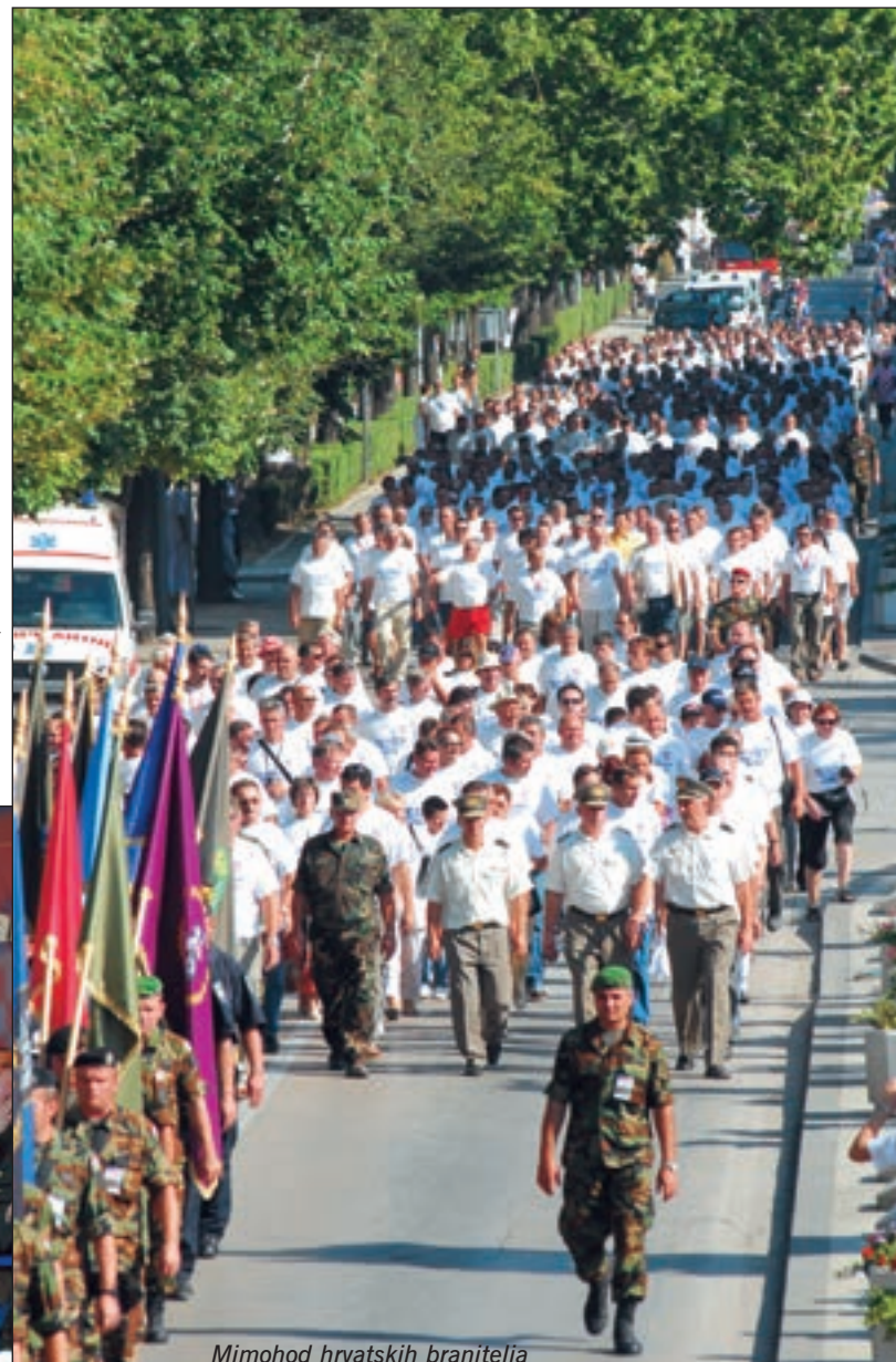
Mimohod hrvatskih branitelja