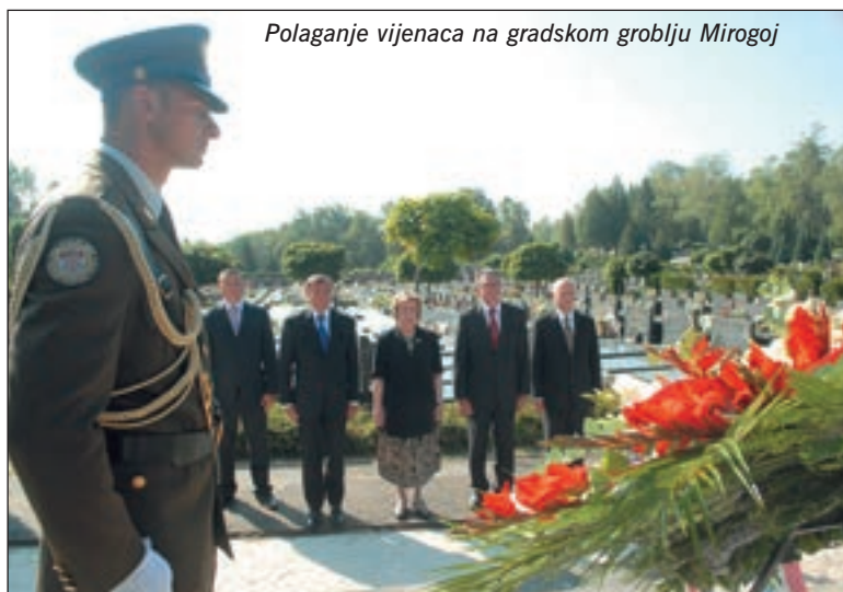
Polaganje vijenaca na gradskom groblju Mirogoj

drugih događanja. Između ostalih, na kninskoj je tvrđavi postavljena izložba znakovlja i opreme obavještajne zajednice u Republici Hrvatskoj te izložba znakovlja Hrvatske vojske iz Domovinskog rata, a predstavljen je i zbornik radova Oluja 1995.-2005. Uz to, i ove su godine na glavnom gradskom trgu Kninjani i svi oni koji su posjetili Knin u informativnim šatorima mogli dobiti niz korisnih informacija o NATO-u, EU-u, programu Kadet te o projektu dragovoljnog služenja vojnog roka. ■