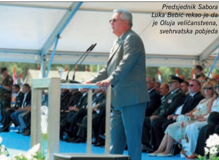
Predsjednik Sabora Luka Bebić rekao je da je Oluja veličanstvena, svehrvatska pobjeda