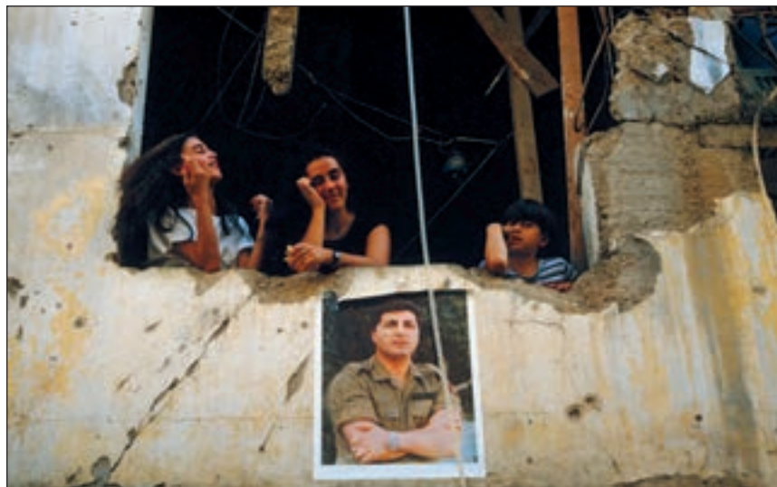
■ Libanonski kršćani još žale za Bashirovom Gemayelom

Chartouni je noć prije u prostoriji na drugom katu zgrade, izravno ispod dvorane u kojoj se skup trebao održati, postavio bombu od 200 kg TNT-a. Detonator za bombu Sirijcima je navodno dostavila bugarska obavještajna organizacija, no konci atentata vjerojatno vode do Sovjetskog Saveza. Chartouni je u zgradu ušao neometano jer, zbog rodbinskih i prijateljskih veza s Falangom, u njega nije bilo sumnje.