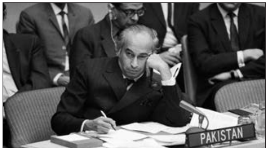
■ Benazir je kći istaknutoga pakistanskog političara Zulfikara Ali-Bhutta (na slici), koji je u Pakistanu osuđen na smrt i obješen, a njezina dva brata također su ubijena pod nerazjašnjenim okolnostima

Nakon dolaska na vlast generala Perveza Musharaffa 1999. godine,