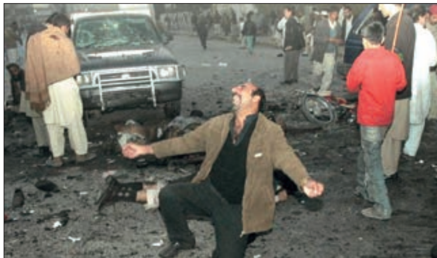
■ U eksploziji koja je uslijedila neposredno nakon što je Benazir Bhutto ubijena poginulo je još dvadeset ljudi

Bhutto je pokopana u mauzoleju u gradu Gharki Khuda Bhaksh, u kojemu je pokopan i njezin otac. Unatoč tom ubojstvu, dinastija Bhutto nije nestala s političke scene. Naime, Benazirin devetnaestogodišnji sin Bilawal Bhutto Zardari imenovan je za novog predsjednika stranke, a do svršetka njegova školovanja tu će dužnost obnašati njezin suprug. ■