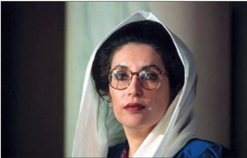
■ Benazir Bhutto prva je žena premijer u islamskom svijetu

B enazir Bhutto rođena je 1953. godine u Karachiju, u uglednoj obitelji pakistanskog političara i narodnog tribuna Zulfikara Ali-Bhutta. U Karachiju je pohađala kršćanske škole, a poslije je dobila priliku obrazovati se na američkom sveučilištu Harvard i britanskom Oxford. Boravak u zapadnim zemljama bio je od presudne važnosti za formiranje njezina stava o važnosti demokracije za razvoj zemlje.