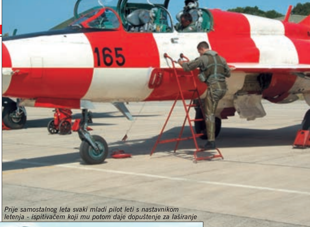
Prije samostalnog leta svaki mladi pilot leti s nastavnikom letenja - ispitivačem koji mu potom daje dopuštenje za laširanje

Prvi njihov samostalni let trajao je pola sata. Sva trojica laširala su uspješno, upravo onako kako je to predvidio pukovnik Ivandić, a emocije koje su ih preplavile poslije leta teško je bilo opisati riječima. "Današnji dan je velika nagrada za naš višegodišnji trud, zalaganje, iščekivanje. Sve se to danas isplatilo", rekao je vidno zadovoljan satnik Turk, napominjući