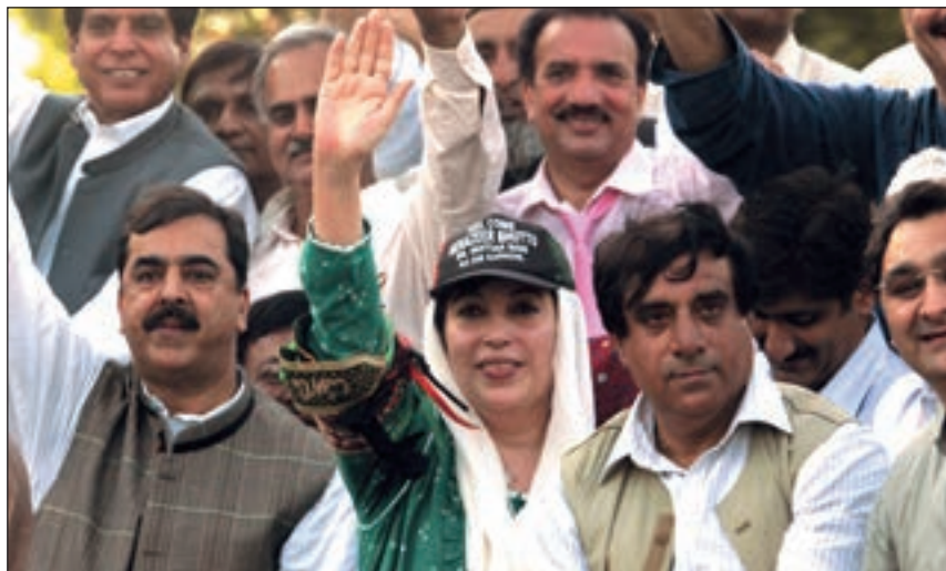
■ Prvi pokušaj atentata na Benazir Bhutto dogodio se na dan njezina povratka u zemlju, 19. listopada 2007. godine

Godinu dana prije povratka, Benazir je stupila u koaliciju s nekadašnjim političkim protivnikom Nawa-