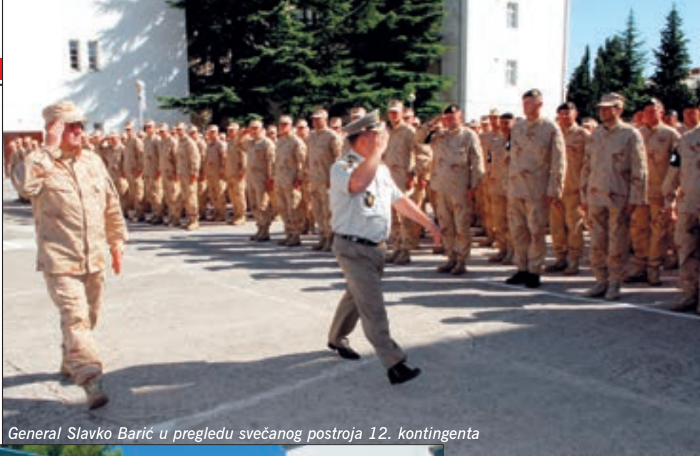
General Slavko Barić u pregledu svečanog postroja 12. kontingenta

General Barić, koji je pripadnicima 12. kontingenta mnogo uspjeha poželio i u ime načelnika GSOSRH-a,