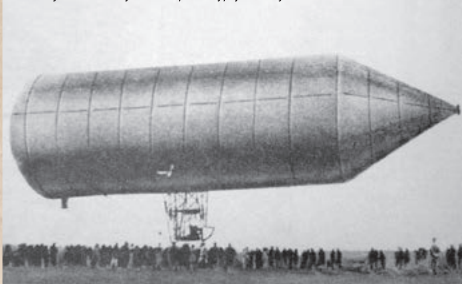
Uzlet druge Schwarzarove letjelice na Tempelhofskoj poljani 1897. godine

Druga Schwarzarova letjelica koju je radio u Berlinu bila je gradisija duljine 47 i širine 13,5 metara. Imala je duraluminijsku konstrukciju obloženu vrlo tankim aluminijevim limom. Unutar aluminijevske ovojnice broda smješteno je sedam zasebnih spremnika s uzgorskim plinom. Cijela konstrukcija broda težila je 3560 kg, a valjkasti prostor za plin (vodik) je imao obujam od 3680 kubičnih metara. Brod je bio aerodinamičnog oblika, najsličniji puščanom zrnu. Imao je valjkast oblik, s prednje strane je bio stožasto zašiljen a straga blago zaobljen. U sredini, ispod metalnog trupa, na rešetkaste nosače obješena je gondola u kojoj se nalazio pogonski benzinski motor tvrtke Daimler snage 16 KS (11,7 kW) i težine 400 kg. Motor je izravno gonio glavnu pogonsku elisu, a dvije bočne upravljačke elise pokretao je putem pogonskog remenja. Izumitelj se odlučio za bočni smještaj elisa kako bi dobio mogućnost upravljanja brodom po pravcu. Velika je elisa bila aksijalno pomična čime je trebalo omogućiti fino upravljanje za vrijeme okretanja broda, a to se trebalo postići i zaustavljanjem jedne bočne elise.