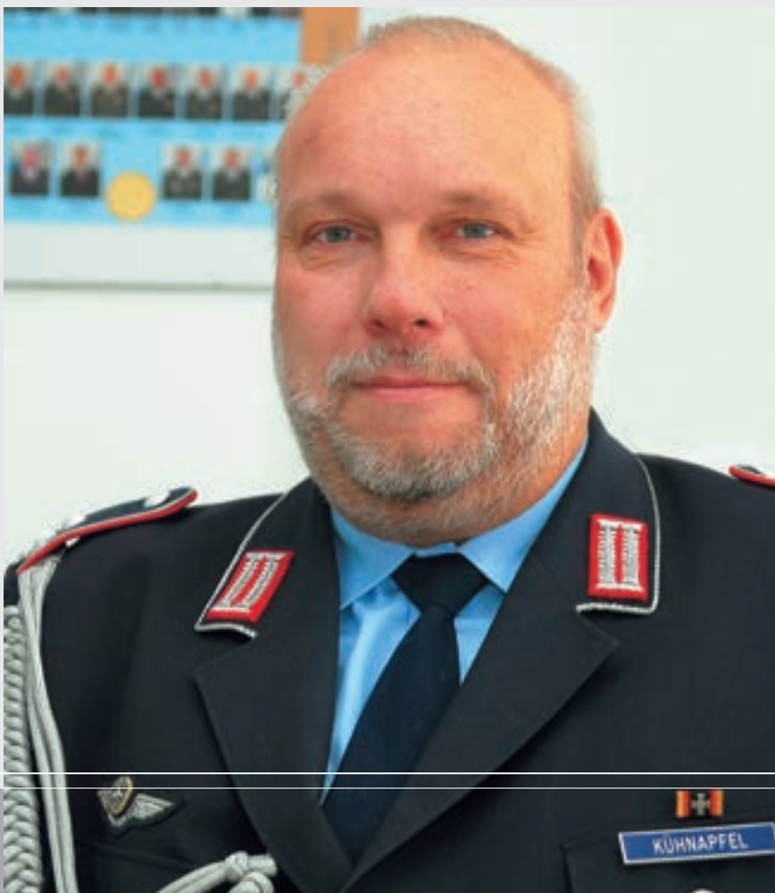
Pukovnik Burkhard Kühnapfel, vojni izaslanik SR Njemačke u RH

Pitanje ulaska Hrvatske u NATO za njemačku stranu više nije tema. S potpisom našega saveznog predsjednika pod odgovarajući zakon, što ga je Bundestag odobrio pred Božić 2008., moja je zemlja dala neosporivu suglasnost za punopravno članstvo Hrvatske u NATO-u. Njemačka će također svim snagama podupirati nastojanje Hrvatske da postane članicom EU-a