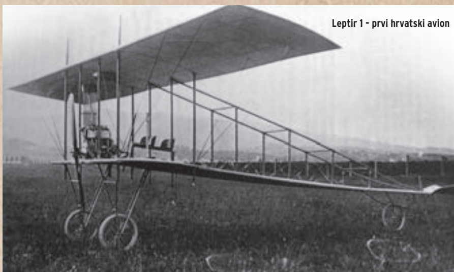
Leptir 1 - prvi hrvatski avion

posebnu uzdužnu trupnu površinu koja je trebala riješiti problem automatske stabilnosti u slučaju pada zrakoplova. Letjelicu je nazvao po leptiru Neptis lucilla, a u tisku je ona dobila jednostavnije ime - Leptir. Zagrebačke Novosti od 16. siječnja 1910. javljaju: "Inžinir Penkala, koji je konstruirao biplan, radi već dvije godine na tom. Penkala je študirao sve leteće strojeve, te je prošle godine bio u Parizu. On je prvobitno htio da kupi jedan aeroplan, pak da ga onda preradi. Konačno se je domislio boljemu i odlučio sagraditi svoj vlastiti aeroplan. Sve dijelove svog aeroplana dao je sagraditi kod domaćih indu-