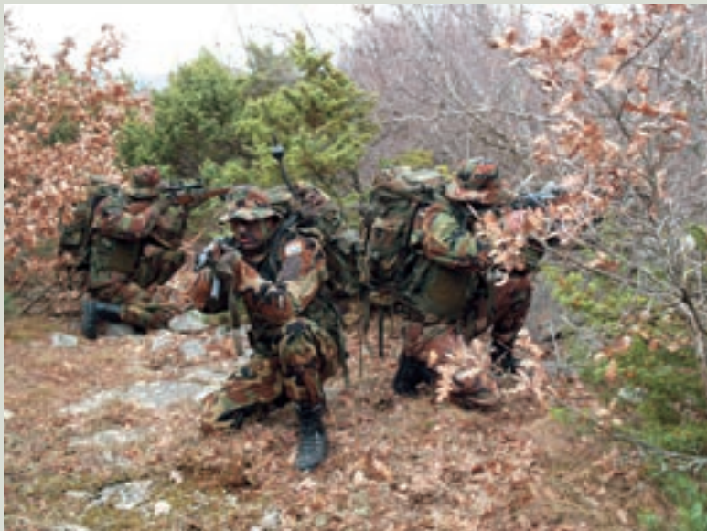
Izvidnička satnija ove se godine priprema za sudjelovanje u sklopu MLOT-a u ISAF-u

Izvidnička satnija ustrojena je od istoimenih postrojbi 1. i 4. GBR te 354. vojno-obavještajne satnije nekadašnjeg IV. korpusa. Iz tih su postrojbi uglavnom stariji, iskusniji pripadnici, koji ujedno čine zapovjedni kadar satnije, a prošle godine ona je popunjena i novim pripadnicima. Prema riječima o.d. zapovjednika natporučnika Branka Fakčevića, satnija provodi vrlo intenzivnu obuku, a u prilog tome govori i podatak da do četiri puta godišnje u kampu "Bralovac" provode izvidničke tabore u trajanju od 8 do 10 dana.