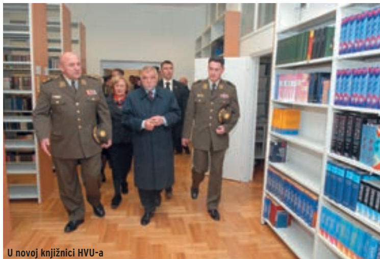
U novoj knjižnici HVU-a