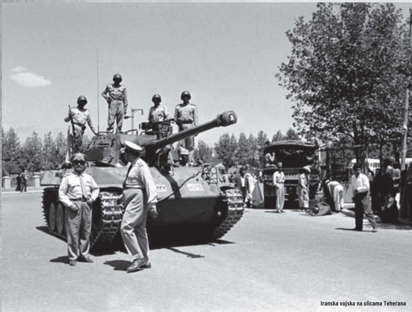
Iranska vojska na ulicama Teherana

Iranske zalihe nafte brzo su nakon otkrivanja zapele za oko europskim kompanijama, tako da je već 1901. godine tadašnji perzijski šah dopustio Anglo-perzijskoj naftnoj kompaniji šezdesetogodišnju koncesiju na eksploataciju nafte, plaćajući na taj način dug Velikoj Britaniji. Zahtjevi nacionalista za preispitivanjem ugovora sa stranim naftnim