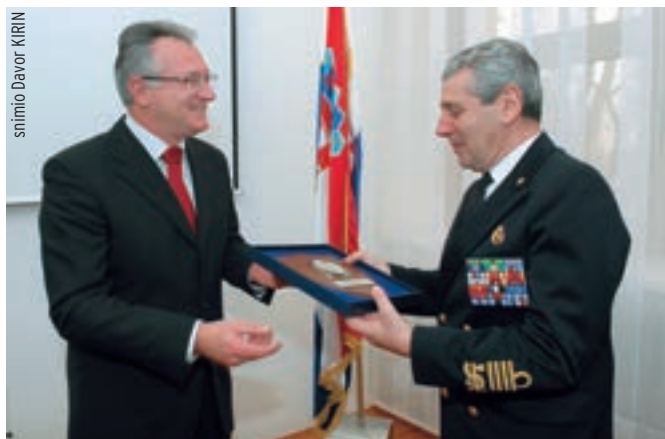
Admiral Di Paola sastao se i s ministrom obrane Brankom Vukelićem