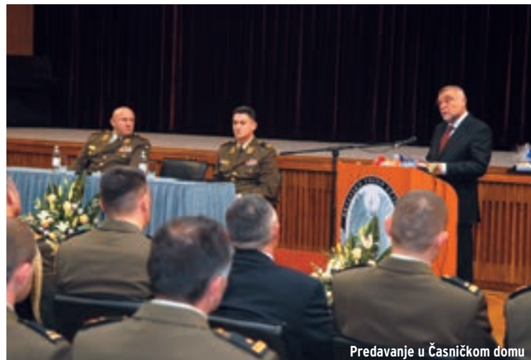
Predavanje u Časničkom domu