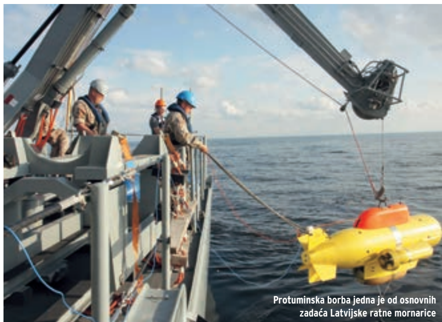
Protuminska borba jedna je od osnovnih zadaća Latvijske ratne mornarice

Treća faza od 2017. do 2020. predviđa uvođenje ustroja mehanizirane brigade. Dotad bi cijela brigada trebala imati pune borbene sposobnosti i