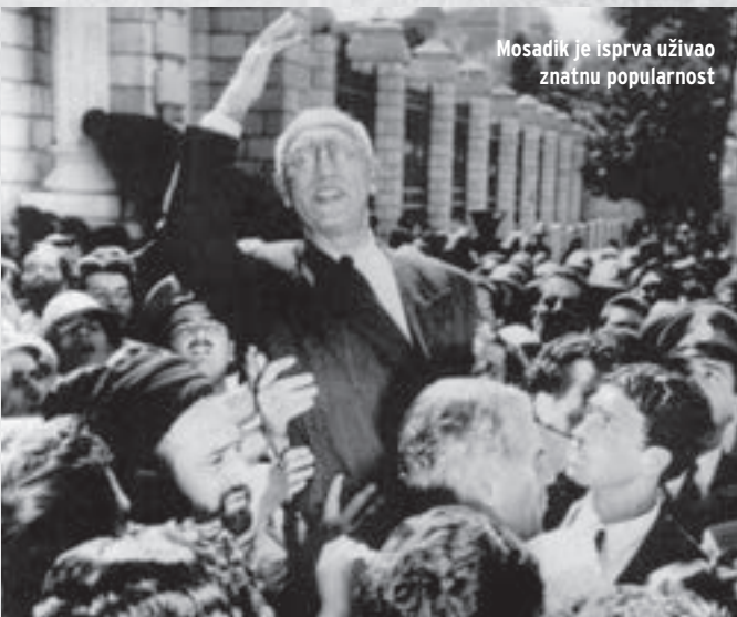
Mosadik je isprva uživao znatnu popularnost

šah pobjegao u inozemstvo. No, četiri dana poslije, 19. kolovoza 1953. rojalistički časnici uz pomoć šahovih pristaša počinju vojni udar. Vojnim snagama je zapovijedao general Fazlollah Zahedi, koji će poslije postati premijer. Tenkovi iranske vojske ulaze u glavni grad te bombardiraju i premijerovu palaču koja je u sukobima zapaljena. Ukupno je u uličnim sukobima i vojnom udaru ubijeno stotinjak ljudi. Premijer Mosadik uspio je pobjeći iz meteža,