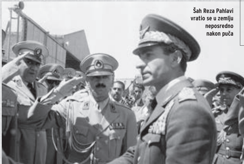
Šah Reza Pahlavi vratio se u zemlju neposredno nakon puča

nu te uvela oštru pomorsku blokadu iranskih luka.