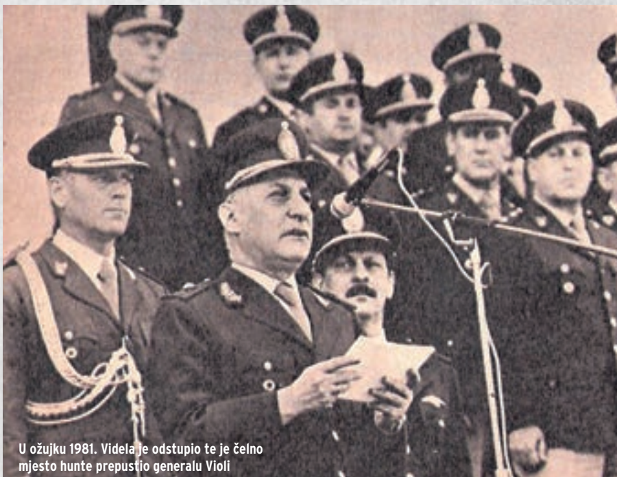
U ožujku 1981. Videla je odstupio te je čelno mjesto hunte prepustio generalu Violi

Vojni neuspjeh na Falklandima nadovezao se na gospodarske i političke probleme koji su razdirali naciju te doveo do eksplozije nezadovoljstva. Stoga je vojna hunta dopustila ponovno djelovanje političkih stranaka i oživljavanje političkih sloboda, što je u konačnici dovelo do njezina pada i restauracije parlamentarne demokracije. Na izborima u listopadu 1983. na čelo Argentine ponovno dolazi građanska osoba – kandidat Radikalne stranke Raul Alfonsin. General Leopoldo Galtieri osuđen je 1983. na dvanaest godina zatvora zbog propusta u vođenju Falklandskog rata, dok su Videla i Viola zatvoreni 1985., a 1990. predsjednik Menem ih je amnestirao. Zanimljivo je da je i svrgnuta Isabel Peron 2007. uhićena u Španjolskoj, gdje se nalazila u egzilu, pod optužbom za kršenje ljudskih prava. No, Madrid ju je odbio izručiti Argentini. ■