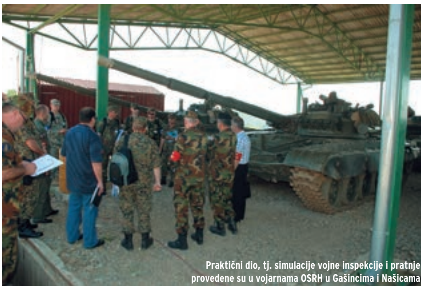
Praktični dio, tj. simulacije vojne inspekcije i pratnje provedene su u vojarnama OSRH u Gašincima i Našicama