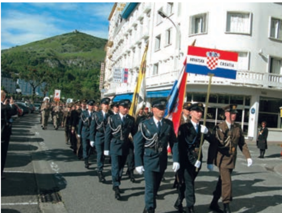
Ove je godine među hodočasnicima iz 64 zemlje svijeta bilo i 1300 hrvatskih