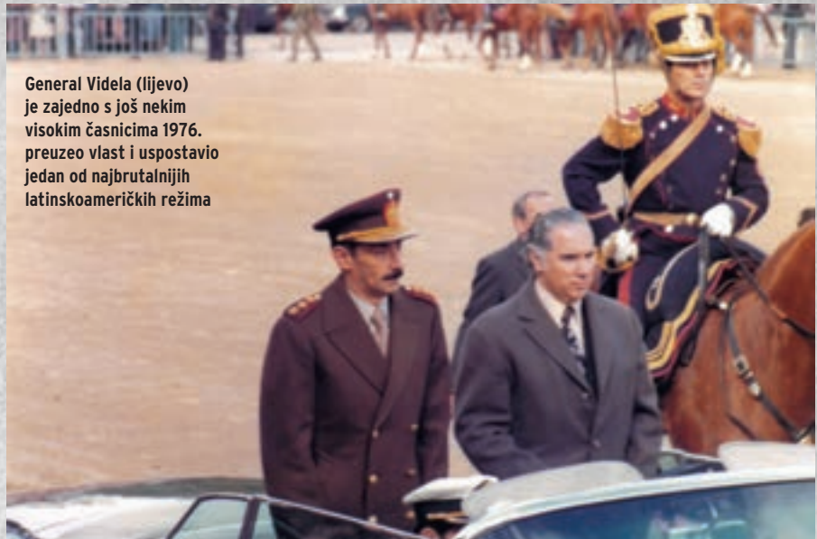
General Videla (lijevo) je zajedno s još nekim visokim časnicima 1976. preuzeo vlast i uspostavio jedan od najbrutalnijih latinskoameričkih režima

Vojna hunta je u pokušaju dobivanja popularne potpore počela igrati na kartu argentinskog nacionalizma i potencirati pitanje granice sa susjedima te je 1978. godine tek diplomatskom aktivnošću spriječen argentinski napad na Čile. Povod je bio nadzor nad skupinom otočića u prolazu na jugu kontinenta. U prilog vojnoj hunti išlo je i održavanje Svjetskog nogometnog prvenstva u Argentini 1978., na kojemu je domaćin osvojio zlatnu me-