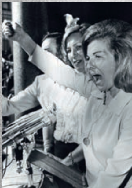
Isabel Peron nikad nije dosegla popularnost slavne Evite

Godine nakon II. svjetskog rata u Argentini prolaze u znaku Juana Antonija Perona. Taj bivši časnik sudjelovao je u vojnom udaru 1943. protiv predsjednika Castilla te bio angažiran u vojnoj vladi. Tada je stekao popularnost u javnosti. Nakon novog vojnog udara 1945. privremeno je zatvoren, no na pritisak javnosti pušten je na slobodu i na izborima 1946. dolazi na vlast. Svojom populističkom politikom s elementima fašizma i socijalizma, koju politolozi nazivaju peronizmom, stekao je potporu među najširim slojevima, čemu je pridonijela i popularnost supruge Evite. U rujnu 1955. vojni je udar zbacio Perona s vlasti te on idućih osamnaest godina provodi u progonstvu u Španjolskoj, a u studenom 1972. ponovno se vraća u zemlju. Na izborima u rujnu 1973. Peron je uvjerljivo izabran za predsjednika, a za potpredsjednicu imenuje