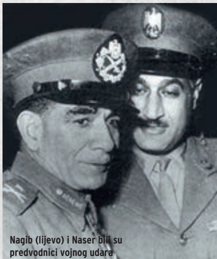
Nagib (lijevo) i Naser bili su predvodnici vojnog udara

Nezadovoljstvo se postupno proširilo na vojne krugove te je naposljetku artikulirano u skupini mlađih časnika egipatske vojske. Kao pripadnici Pokreta slobodnih časnika odlučili su preuzeti vlast u zemlji. Časnici su bili predvođeni vojnim instruktorom s vojne akademije u Kairu, Gamalom Abdelom Naserom. No, formalni vođa vojnog udara bio je ugledni general Muhamed Nagib. Naser je zahvaljujući svom vojnom položaju od 1949. okupljao časnike koji su bili nezadovoljni tadašnjim vojnim i političkim položajem Egipta te je u ljeto 1952. procijenio da je nezadovoljstvo monarhijom u egipatskoj javnosti doseglo kritičnu razinu.