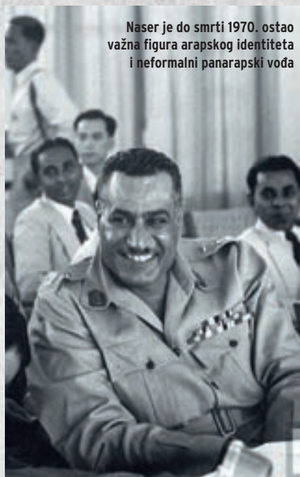
Naser je do smrti 1970. ostao važna figura arapskog identiteta i neformalni panarapski vođa

Ujutro 23. srpnja 1952. Naser se obratio egipatskoj javnosti putem radio-postaje i objasnio razloge vojnog udara te političke ciljeve pučista. Sljedećeg dana egipatska je vojska okupirala Aleksandriju, u kojoj se nalazila Farukova palača Montaza. Suočen s gubitkom vlasti, kralj je pokušao zatražiti pomoć od SAD-a a potom neuspješno brodom napustiti zemlju. Vlast je preuzelo četrnaesteročlano Revolucionarno vijeće pod Nagibovim predsjedanjem. Osim devet pripadnika Pokreta slobodnih časnika, vijeće je uključivalo i civilne osobe. Pitanje što sa svrgnutim Farukom pokazalo se ozbiljnim problemom među pučistima. Jedna struja časnika tražila je