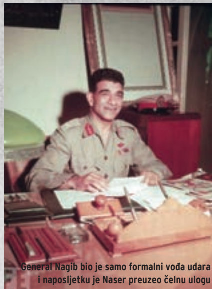
General Nagib bio je samo formalni vođa udara i naposljetku je Naser preuzeo čelnu ulogu

U lipnju 1953., nakon 150 godina, srušena je monarhija i vladavina dinastije Muhameda Alija te proglašena republika. Padom egipatske monarhije nastupila je prekretnica i u međunarod-