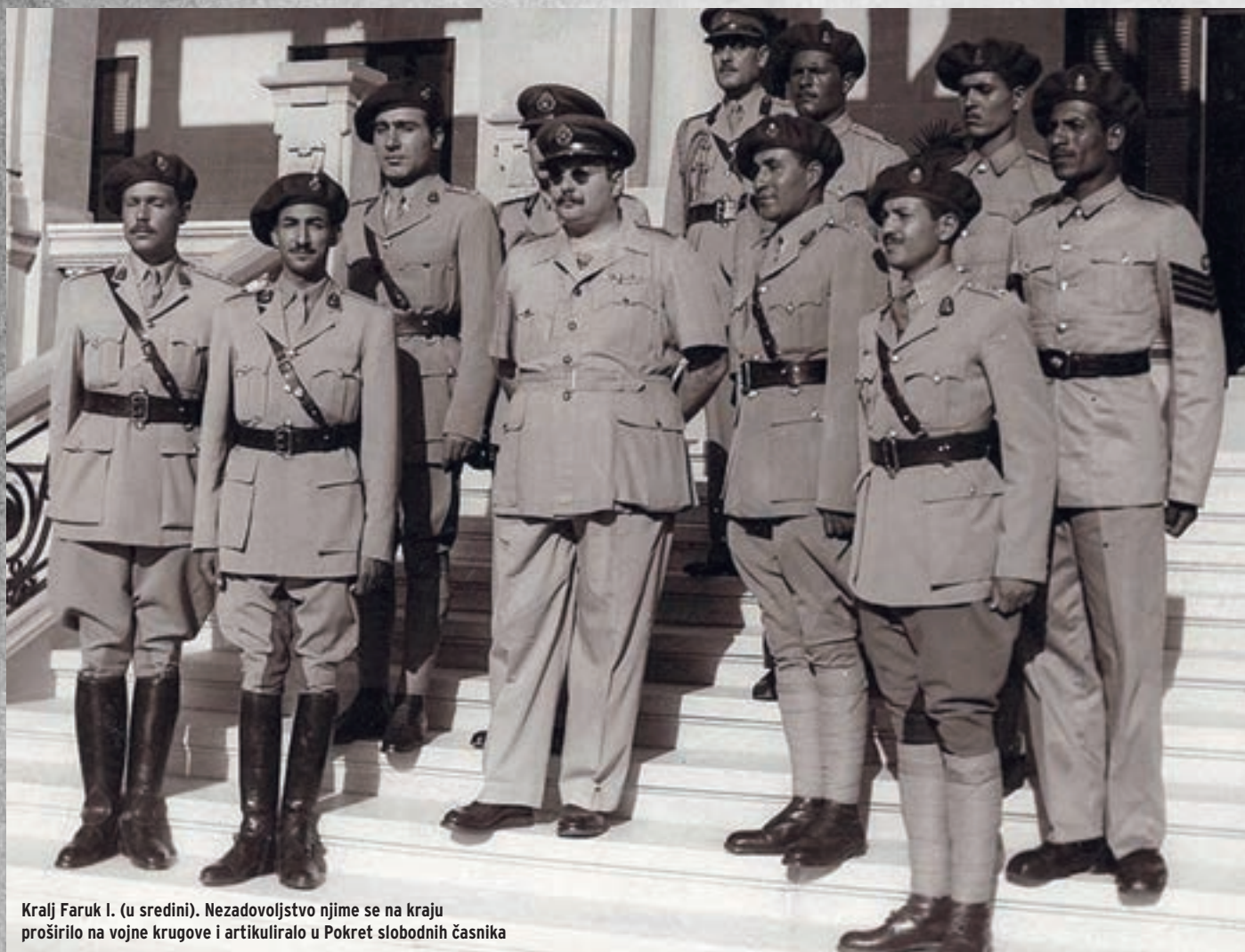
Kralj Faruk I. (u sredini). Nezadovoljstvo njime se na kraju proširilo na vojne krugove i artikuliralo u Pokret slobodnih časnika

Egipat je nakon 1882. bio britanski protektorat, a nakon 1922. nezavisna kraljevina premda uza snažnu britansku vojnu i političku nazočnost, te je do 1956. uključivao i današnji Sudan. Poraz arapskih vojski, među kojima i egipatske, u prvom izraelsko-arapskom ratu 1949. srušio je nade u svearap-