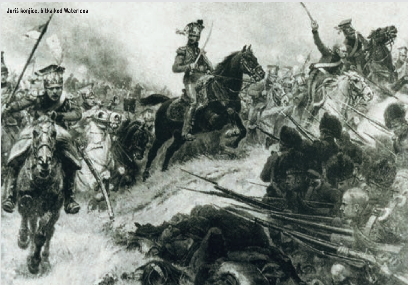
Juriš konjice, bitka kod Waterlooa

dana), kako se naziva njihovo oružništvo (žandarmerija).