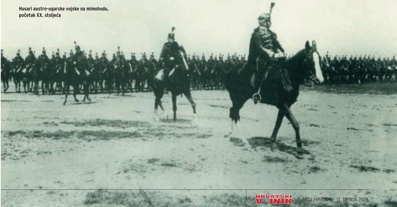
Husari austro-ugarske vojske na mimohodu, početak XX. stoljeća

Napoleon je u sastavu svoje garde imao neregularne postrojbe Mameluka, priključenih francuskoj vojsci nakon pohoda na Egipat 1798. koji su svojom egzotičnom pojavom plijenili pozornost gdje su se pojavljivali, ali u borbama su bili iznimno hrabri i požrtvovalni (čak je i Napoleonov čuveni tjelesni čuvar Rustan bio Mameluk). ■