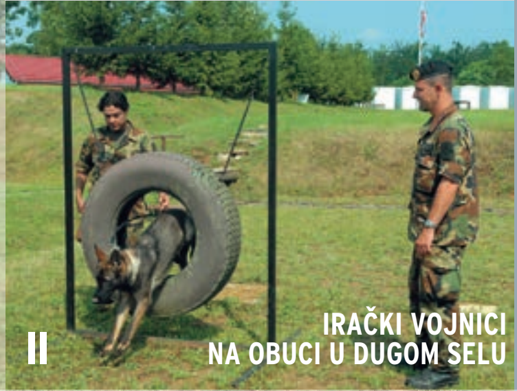
IRAČKI VOJNICI NA OBUCI U DUGOM SELU