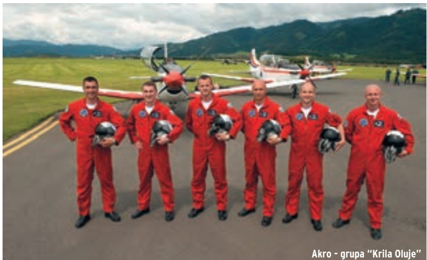
Akro - grupa "Kрила Oluje"