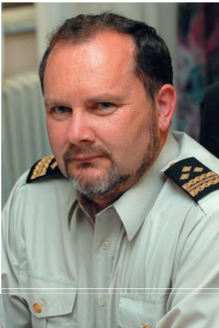
general-pukovnik Slavko Barić, zamjenik načelnika GSOSRH za planiranje i resurse