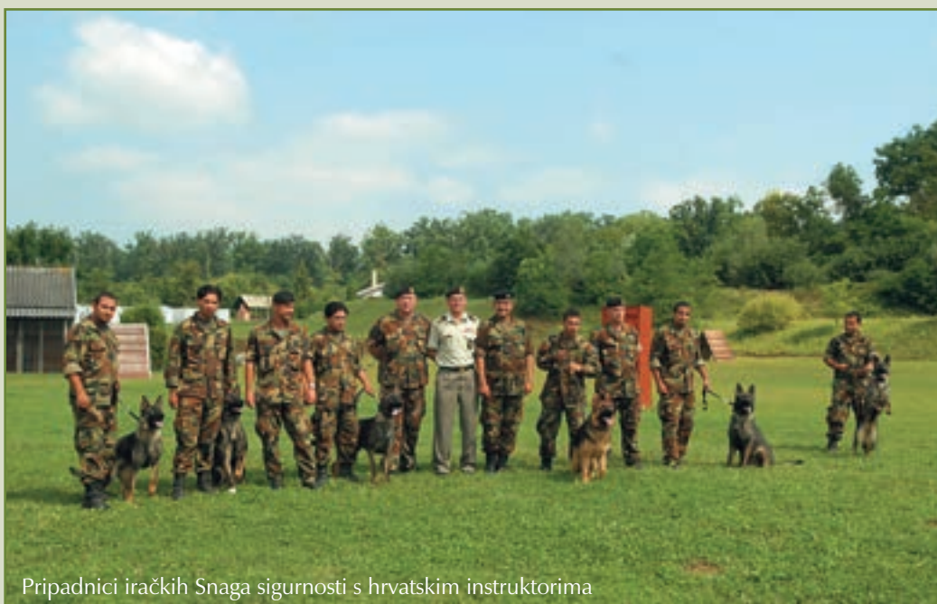
Pripadnici iračkih Snaga sigurnosti s hrvatskim instruktorima