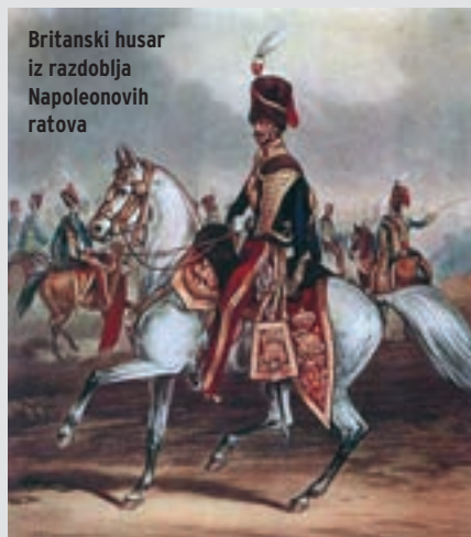
Britanski husar iz razdoblja Napoleonovih ratova

Husari su bili elitne postrojbe u pravom smislu te riječi - neobuzdani jahači velike srčanosti, na brzim, temperamentnim konjima i odjeveni u vrlo slikovite odore; u razdoblju Napoleonovih ratova postali su personifikacijom lakog konjaništva. Prvobitno se javljaju kao teško oklopljeno konjaništvo u Mađarskoj i Poljskoj u drugoj polovici XV. stoljeća, da bi njihovo ime vrlo brzo prihvatilo neregularno lako konjaništvo, koje se razvilo tijekom ratova s Turcima u Hrvatskoj i Ugarskoj potkraj XV. i početkom XVI. stoljeća. Husari su bili ustrojeni u manje skupine i banderije koje su služile na granici s Osmanskim Carstvom, a u XVII. stoljeću sudjeluju u Tridesetogodišnjem ratu osobito se istaknuvši u tzv. malom ratu (nasilnom izviđanju, prepadima, reidovima, progonima, iznenadnim napadima na pozadinske elemente protivnika i sl.). U tom ratu su se posebno isticala pukovnije husara podrijetlom iz Vojne krajine, koje su pod jedinstvenim nazivom "Hrvati" postale čuvene po hrabrosti i učinkovitosti u cijeloj tadašnjoj Europi, te vrlo tražene kao najamničke postrojbe u mnogim europskim zemljama. Upravo zbog toga, a poznavajući tradiciju i borbenu vrijednost husara u Hrvatskoj, Dvorsko ratno