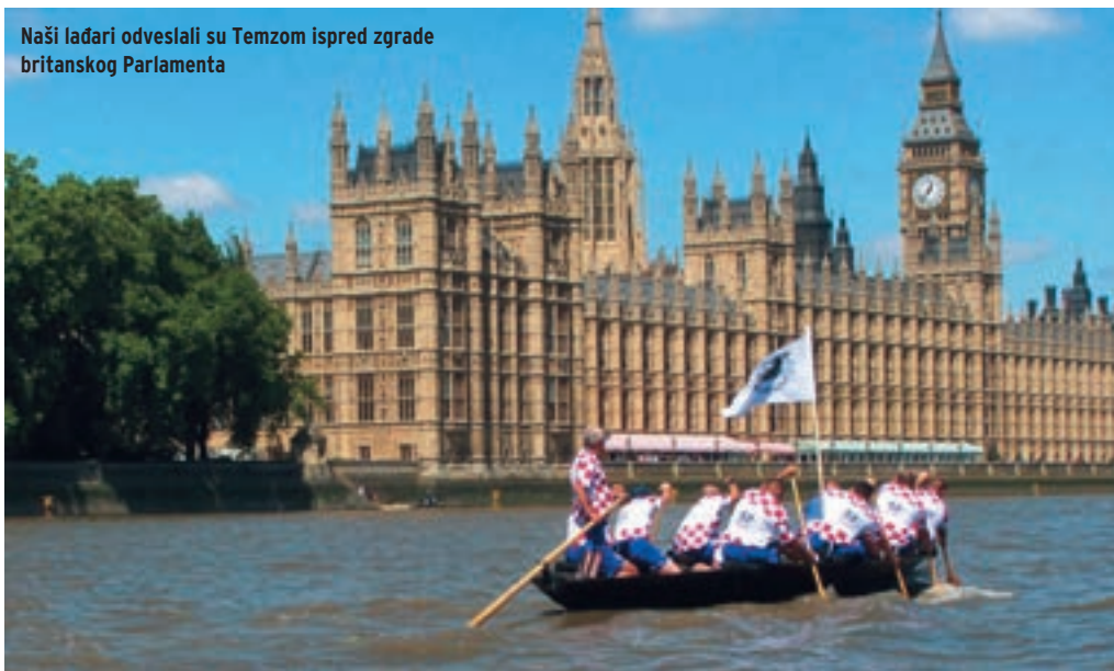
Naši lađari odveslali su Temzom ispred zgrade britanskog Parlamenta

nije omela da još jače sokolimo ekipu u lađi u tim trenucima. Nakon tri sata i 40 minuta dođirujemo francusku obalu. Oduševljenje je bilo veliko: ispunili smo naš cilj i s neretvanskom lađom preveslali La Manche! Od 123 poku-