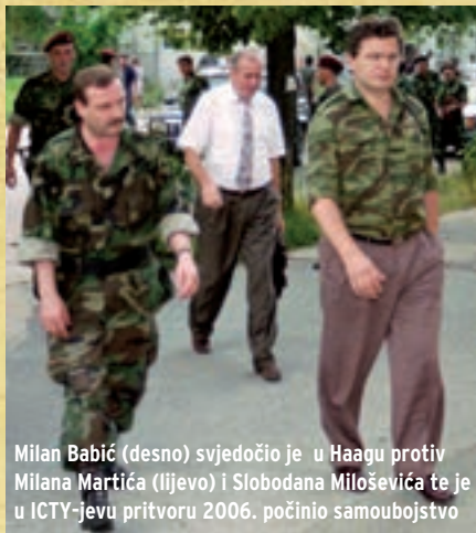
Milan Babić (desno) svjedočio je u Haagu protiv Milana Martića (lijevo) i Slobodana Miloševića te je u ICTY-jevu pritvoru 2006. počinio samoubojstvo

Najavljiivač: Kada slušam riječi jednog mladog i uglednog čovjeka, onda osjećam da našim prostorima i kroz naš zrak struji jedinstvo i sloga. To su riječi našeg mladog doktora Milana Babića!