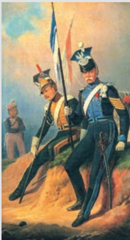
Poljski ulani druge polovice XVIII. stoljeća

Unatoč relativno maloj manevarskoj sposobnosti i pokretljivosti, te potrebnima iznimno precizne taktičke uporabe, važnost kirasira u konjaništvu većine europskih zemalja zadržala se praktično tijekom cijelog XIX. stoljeća ponajprije zbog njihove siline udara. Međutim nakon Krimskog rata (1853. - 1856.) sve jača i preciznija paljba vatrenog oružja učinila je frontalne napade masovnih