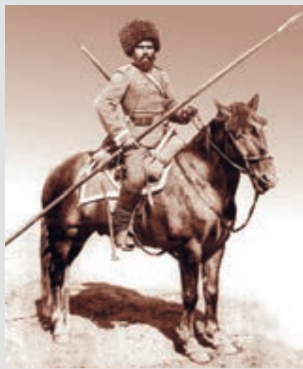
Donski Kozak s kraja XIX. stoljeća. Za razliku od europske prakse, Kozaci su se rado koristili i kopljem i puškom (ovisno o prilici)

Od ostalog konjaništva husari su se razlikovali po svom izgledu, sustavu vrijednosti i vojničkom kodeksu, te naoružanjem i taktikom borbenog djelo-