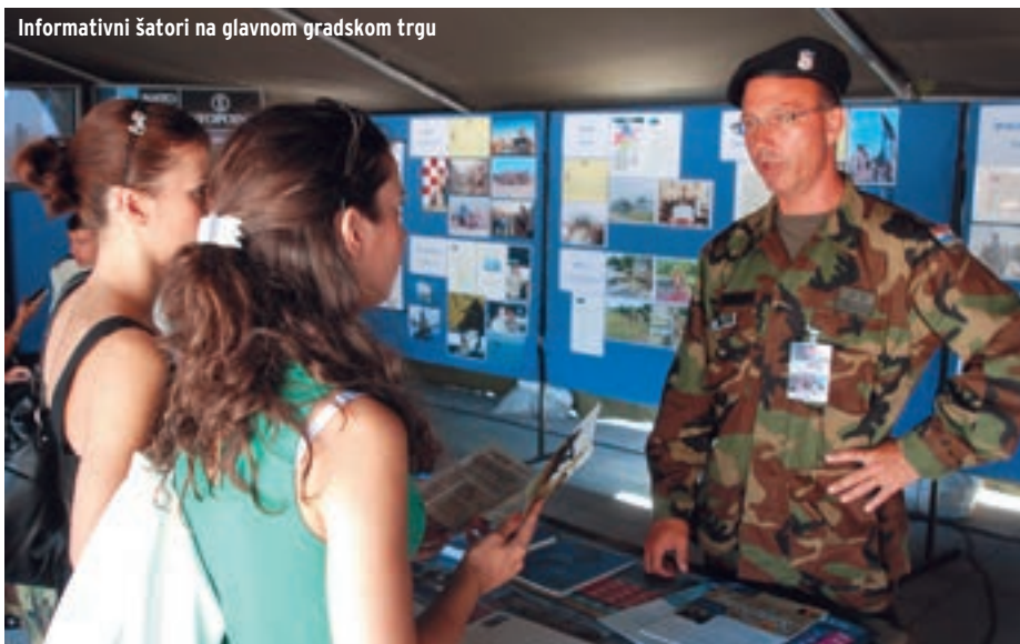
Informativni šatori na glavnom gradskom trgu

Najviši državni i vojni vrh koji se ovom prigodom okupio u Kninu te brojni okupljeni građani na kraju su mogli uživati u