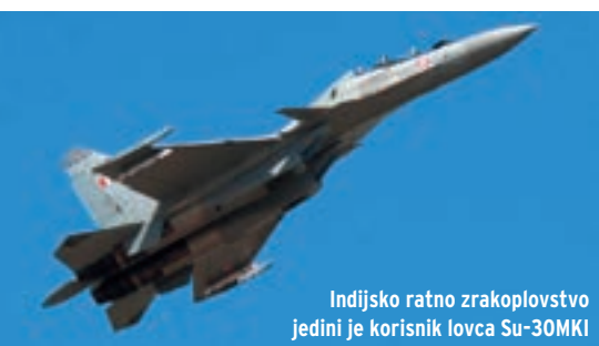
Indijsko ratno zrakoplovstvo jedini je korisnik lovca Su-30MKI

Kao protutežu kineskim J-11A, Vijetnam je kupio 36 Su-27SK. Indonezija je nedavno naručila još tri Su-27SKM,