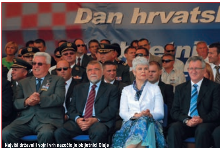
Najviši državni i vojni vrh nazočio je obilježnici Oluje

“Zahvaljujući Oluji i drugim ratnim pobjedama te demokratskom razvoju, možemo s ponosom istaknuti da je Republika Hrvatska jedinstveni primjer zemlje koja se od primateljice međunarodne pomoći vrlo brzo prometnula u zemlju koja je na europskoj i globalnoj razini postala važan subjekt međunarodnih odnosa“, rekao je predsjednik RH Stjepan Mesić, zahvalivši svima