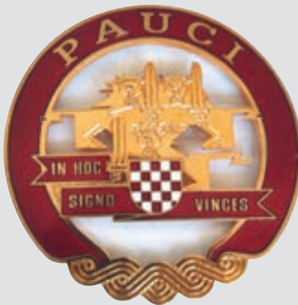
Zbirka: Plakete i medalje Plaketa "PAUK" 4. gardijska brigada

Središnji dio plakete sa znakom 4. gardijske brigade, koji je nastao u Zagrebu u ožujku 1992., nalazi se na baršunastoj podlozi kutije dimenzija 139 x 179 x 23 mm, od crne glatke kože, na čijoj je gornjoj strani otisnut pozlaće-