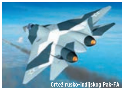
Crtež rusko-indijskog Pak-FA

Indijski Su-30MKI neslužbeno se smatra najpokretljivijim lovačkim avionom na svijetu. Nastao je tako da je na osnovama dvosjeda Su-30 (koji nije u operativnoj uporabi) za potrebe indijskog ratnog zrakoplovstva razvijen višenamjenski borbeni avion Su-30MKI. Na postojeću platformu stručnjaci Suhoja dodali su kanarde od kompozita i FBW sustav za kontrolu leta razvijen za mornarički Su-33, motore AL-31AP s vektorizacijom potiska i modernu elektroniku. U nos je ugrađen suvremeni radar N001 Bars 3, koji omogućava istodobni napad na jedan cilj u zraku i jedan cilj na zemlji. Avionika je mješavina ruskih, francuskih, izraelskih i indijskih sustava, te je u početku bilo problema s njihovom integracijom u jedinstveni sustav. Naoružanje se sastoji od projektila zrak-zrak srednjeg dometa R-27 i RVV-AE (R-77) i kratkog dometa R-73E. Može nositi protubrodске i vođene projektele zrak-zemlja ruske i indijske proizvodnje. Indijski mediji Su-30MKI proglašavaju