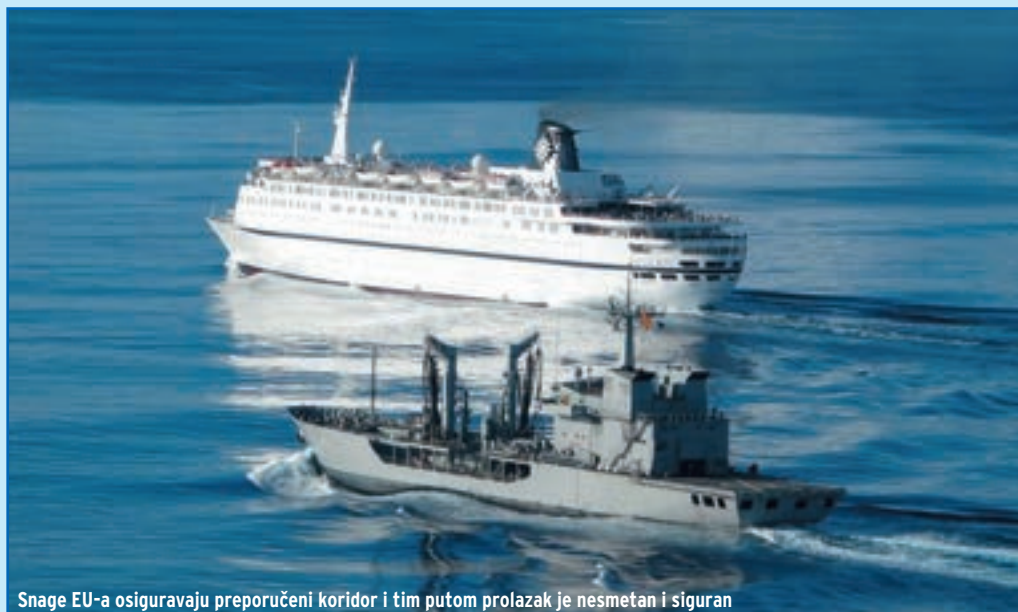
Snage EU-a osiguravaju preporučeni koridor i tim putom prolazak je nesmetan i siguran

Operacija ATALANTA pokrenuta je u skladu s rezolucijama Vijeća sigurnosti UN-a 1814, 1816 i 1838, kako bi se zaštitili brodovi pod zastavom Svjetskog programa za hranu koji plove područjem od Adena do El Maana, trgovački brodovi koji plove u području provedbe operacije, te kako bi se provodio nadzor obalnog područja Somalije, uključujući i teritorijalne vode, te odbili sve češći napadi pirata i spriječile oružane pljačke u vodama Somalije. Predviđeno je da operacija traje dvanaest mjeseci, do 15. prosinca 2009.