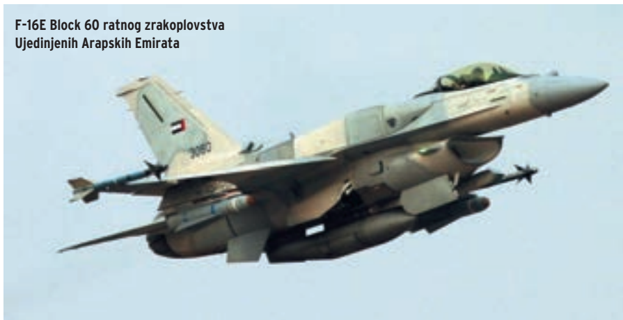
F-16E Block 60 ratnog zrakoplovstva Ujedinjenih Arapskih Emirata

kupcima isporučiti i s nekim drugim motorom.