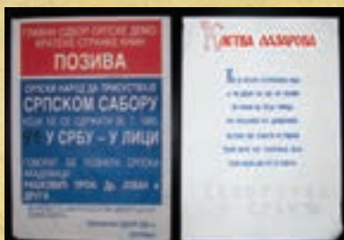
Jovan Rašković u Srbu 25. srpnja 1990.

1. U granicama SR Hrvatske koja je država i Srpskog naroda koji živi u SR Hrvatskoj, Srpski narod je na osnovu svojih geografskih, istorijskih, društvenih i kulturnih osobnosti suveren narod sa svim pravima koja sadržava suverenost naroda. Srpski narod u