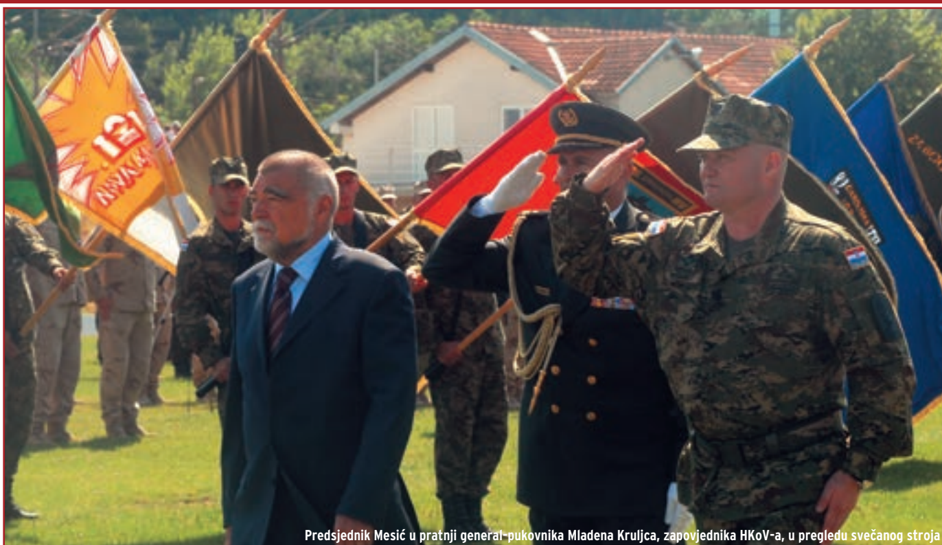
Predsjednik Mesić u pratnji general-pukovnika Mladena Kruljca, zapovjednika HKoV-a, u pregledu svečanog stroja