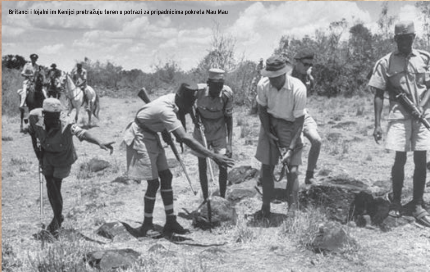
Britanci i lojalni im Kenijci pretražuju teren u potrazi za pripadnicima pokreta Mau Mau

Istočnoafrička kolonija Kenija se nakon II. svjetskog rata pokazala jednom od najproblematičnijih točaka nestajućeg britanskog carstva. Početkom pedesetih godina imala je oko 5,6 milijuna stanovnika, od čega su četrdeset tisuća činili europski doseljenici, stotinjak tisuća stanovnika su podrijetlom bili Indijci dok su ostalih pet i pol milijuna Kenijanci. Europljani su posjedovali najveće dijelove obradivih poljoprivrednih površina u zemlji a Indijci su popunili kolonijalnu administraciju i nadzirali trgovinu na malo. Doseljavanje Europljana u Keniju počinje nakon II. svjetskog rata. Tada oni, zahvaljujući