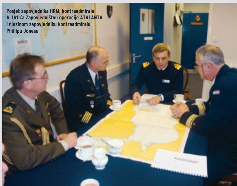
Posjet zapovjednika HRM, kontraadmirala A. Urličića Zapovjedništvu operacije ATALANTA i njezinom zapovjedniku kontraadmiralu Phillippu Jonesu

Zajedničkom akcijom 2008/851/CFSP EU od 10. studenog 2008. donijela je odluku o provedbi mirovne operacije kojom će se pomoći provedba rezolucija Vijeća si-