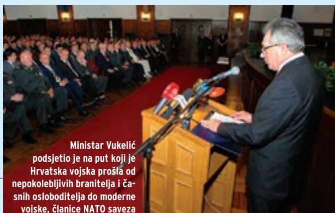
Ministar Vukelić podsjetio je na put koji je Hrvatska vojska prošla od nepokolebljivih branitelja i časnih osloboditelja do moderne vojske, članice NATO saveza