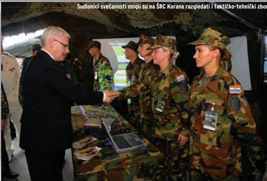
Sudionici svečanosti mogli su na ŠRC Korana razgledati i taktičko-tehnički zbor

Prisjećajući se povijesnog postrojavanja Zbora narodne garde 1991. godine na zagrebačkom stadionu u Kranjčevićevoj načelnik GSOSRH-a general zbora Josip Lucić je rekao da su današnje suvremene OS sljednica slavne i ponosne vojske koja je obranila i oslobodila hrvatsku državu. "Svjesni smo financijskih ograničenja, ali odgovorno možemo obećati da će OSRH i ubuduće ispunjavati sve zadaće pred njih postavljene", istaknuo je general Lucić zahvaljujući svima koji su pridonijeli izgradnji OS-a i svojim odgovornim i predanim radom uveli RH u NATO.