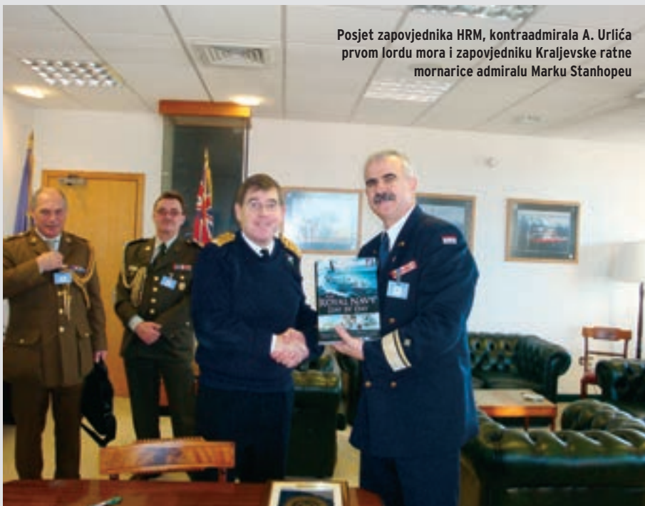
Posjet zapovjednika HRM, kontraadmirala A. Urlića prvom lordu mora i zapovjedniku Kraljevske ratne mornarice admiralu Marku Stanhopeu

Uključenje Republike Hrvatske u operaciju ATALANTA dokaz je da se naša