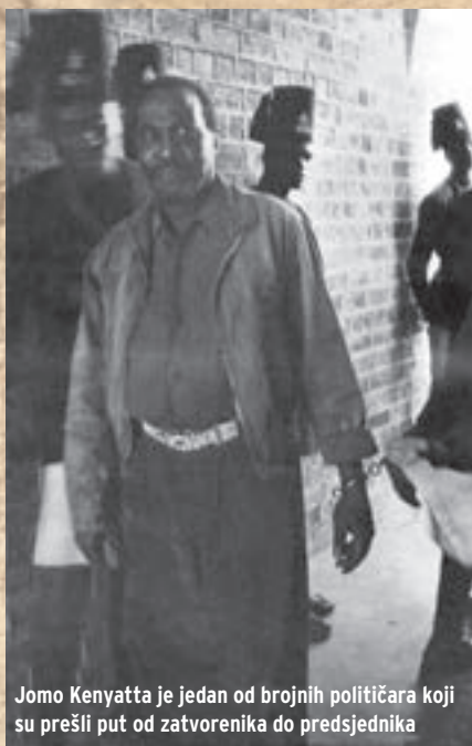
Jomo Kenyatta je jedan od brojnih političara koji su prešli put od zatvorenika do predsjednika

Tijekom 1953., britanske su snage izvele opsežnu operaciju likvidacije ustanika na području šume Aberdare. Zahvaljujući toj i sličnim operacijama, utjecaj pokreta Mau Mau je do kraja 1953. uvelike opao. Padu popularnosti Mau Mau među crnim stanovništvom