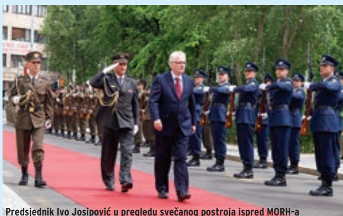
Predsjednik Ivo Josipović u pregledu svečanog postroja ispred MORH-a

Povodom Dana OSRH-a i Dana HKoV-a promaknuto je 148 pripadnika i pripadnika OSRH-a te su dodijeljena četiri prva časnička čina, a u ime promaknutih, nagrađenih i pohvaljenih zahvalio je brigadni general Vlado Šindler. Svečana akademija završila je prigodnim programom Orkestra OSRH-a. ■