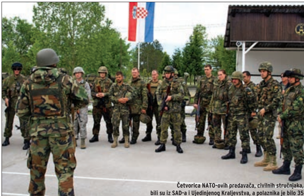
Četvorica NATO-ovih predavača, civilnih stručnjaka, bili su iz SAD-a i Ujedinjenog Kraljevstva, a polaznika je bilo 35

U vojarni se provodio teoretski, a na poligonu praktični dio. Osobito dojmljiv bio je praktični dio, zbog niza različitih simuliranih improviziranih naprava s kojima se radilo, kao i vjernih simulacija svjetlosnih i zvučnih efekata. Stoga, postoje tendencije da će tečaj postati stalan, te da će se barem dvaput godišnje provoditi u RH, uz potporu OSRH. Inače, slični tečajevi provode se od šest do osam puta godišnje, uglavnom u Europi