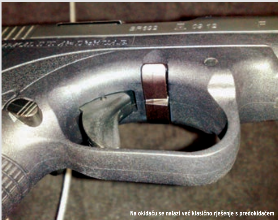
Na okidaču se nalazi već klasično rješenje s predokidačem

Navlaka je u svome stražnjem dijelu s bočnih strana klasično okomito narezana širokim tipom nareza koji bi trebao omogućiti bolji i čvršći zahvat kod repetiranja oružja. Nažalost treba biti iskren i reći da u praksi ovaj tip nareza na Caracalu baš i ne funkcionira najbolje. Vrlo vjerojatno baš zbog zaobljena gornjeg dijela navlake, a koji je znatno smanjio visinu površine nareza te tako korisnik nije u mogućnosti u potpunosti željeznim stiskom obuhvatiti navlaku. Kućište pištolja izrađeno je od visokootpornog i žilavog polimera što je danas standard u ovoj klasi pištolja. U dijelu rukohvata na mjestu bočnih panela predviđena je mogućnost ugradnje umetaka različite boje. To omogućuje krajnjem korisniku,