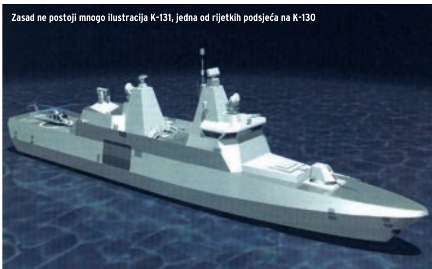
Zasad ne postoji mnogo ilustracija K-131, jedna od rijetkih podsjeća na K-130

Istodobno se u istom smjeru razvijaju planovi britanske ratne mornarice (Royal Navy) za fregate tipa 26/Future MCM Hydrographic Patrol Capability, FMHPC i francuske ratne mornarice BATSIMAR (Bâtiments de Surveillance et d'Intervention Maritime).