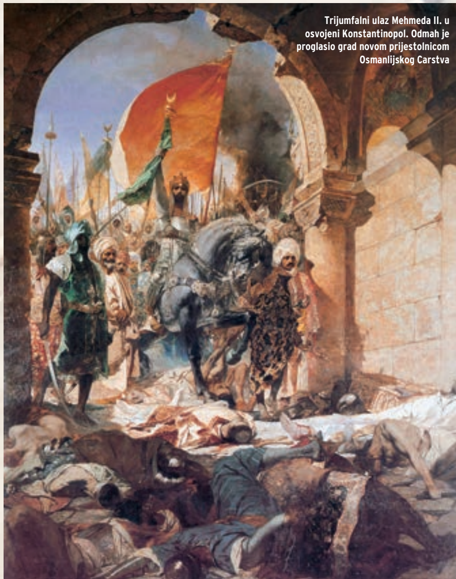
Trijumfalni ulaz Mehmeda II. u osvojeni Konstantinopol. Odmah je proglasio grad novom prijestolnicom Osmanlijskog Carstva

Usporedno s neprekidnim topničkim bombardiranjem grada, Turci su iskopali podzemni hodnik i veliku galeriju ispod vanjskog bedema. Namjeravali su je napuniti barutom i dignuti u zrak dio zidina ispod kojih se nalazila. No, galerija je otkrivena 16. svibnja. Iako su je branitelji zarušili, otkriće je izazvalo veliku paniku među stanovništvom grada, što je znatno uzdrmalo i borbeni moral branitelja. Novu paniku među stanovništvom, a dijelom i kod branitelja, izazvala je pojava velike pokretne opsadne kule 18. svibnja. Topovi kojima je kula bila naoružana napravili su u bedemu novu brešu. Juriš koji je uslijedio na tu brešu ponovno je odbijen, a branitelji su uspjeli zapaliti i opsadnu kulu. Unatoč još jednoj pobjedi, branitelji su potkraj