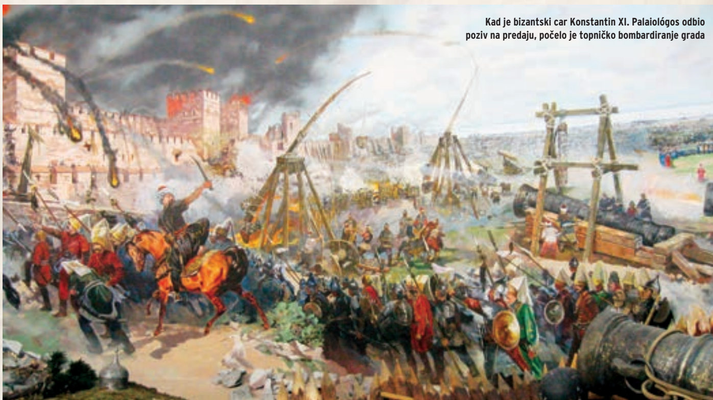
Kad je bizantski car Konstantin XI. Palaiologos odbio poziv na predaju, počelo je topničko bombardiranje grada

U sklopu priprema za opsadu Konstantinopola , Mehmed II. je 1452. godine na europskoj obali Bospora sagradio vrlo snažnu utvrdu Rumelihisar. Na njezinim su osmerokatnim kulama širine do 25 m i zidova debelih prosječno 7,5 m postavljeni topovi za kontrabatiranje (djelovanje topništva protiv topništva protivnika – op. aut.) i rušenje snažnih bedema grada. Do siječnja 1453. pripremio je veliku vojsku i vrlo snažno topništvo među kojim se u turskim analizama posebno navodi veliki opsadni top sposoban za ispaljivanje kamenog projektila mase oko 550 kg. Osim toga, izgradio je čvrste opsadne kule koje je namjeravao u dijelovima