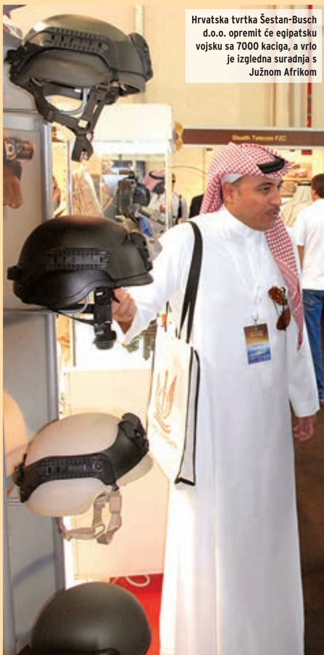
Hrvatska tvrtka Šestan-Busch d.o.o. opremit će egipatsku vojsku sa 7000 kaciga, a vrlo je izgledna suradnja s Južnom Afrikom

Hrvatska namjenska industrija je u 2011. godini konačno dobila novi zamah, i to na najbitnijem polju, izvoznom. Izgovoriti rečenicu ovako kategorički i nije teško, kad se pogledaju podaci o poslovima koje su hrvatske tvrtke sklopile na prošlotjednom sajmu vojne opreme i naoružanja "IDEX 2011" u Abu Dhabiju. Dakle, Šestan-Busch d.o.o. zaključio je četverogodišnji ugovor za opremanje egipatske vojske sa 7000 kaciga, a Kroko International d. o. o. će opremiti kuvajtsku specijalnu policiju s impresivnih 40 000 komada odora, 10 000 komada odjeće za specijalne namjene i 5000 pancirnih prsluka.