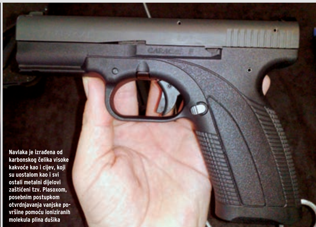
Navlaka je izrađena od karbonskog čelika visoke kakvoće kao i cijev, koji su uostalom kao i svi ostali metalni dijelovi zaštićeni tzv. Plasoxom, posebnim postupkom otvrdnjavanja vanjske površine pomoću ioniziranih molekula plina dušika

pripremi su modeli kalibra .45 ACP te čak i potkalibarni modeli u izvedbama za kalibre 5.7 x 28 mm i 4.6 x 30 mm. No treba vidjeti što će vrijeme pokazati... Jedno su planovi, a drugo tržišna perspektiva.