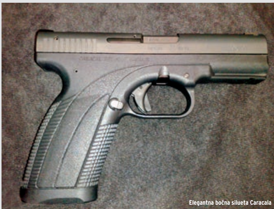
Elegantna bočna silueta Caracala

U ovu bi se kategoriju mogao čak svrstati poznati i nadaleko čuveni njemački Walther s modelom P99 (relativan uspjeh na njemačkom policijskom tržištu te nekoliko izvoznih ugovora poput onog s finskom vojskom i licencne proizvodnje za potrebe poljske vojske) te Steyr Mannlicher s modelom serije M (M9, M40