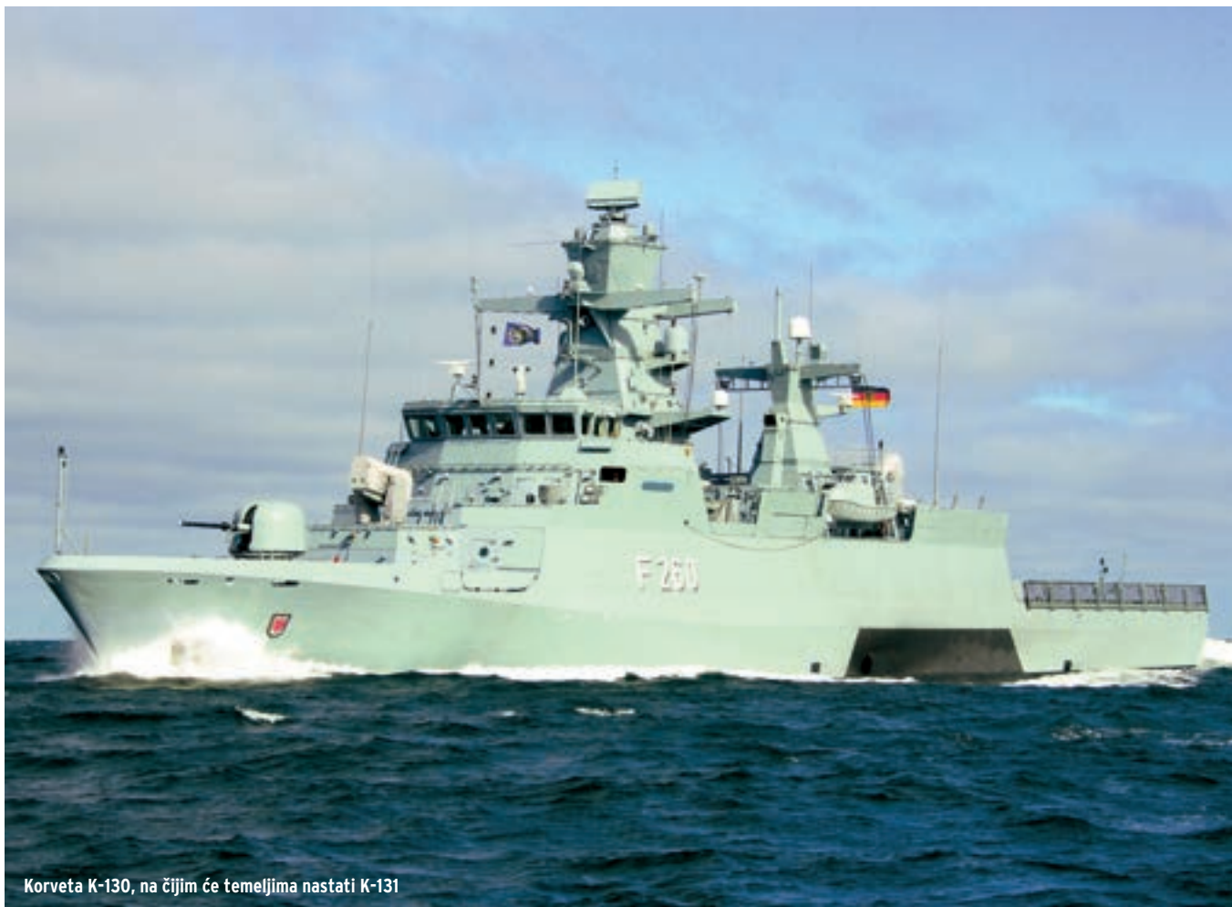
Korveta K-130, na čijim će temeljima nastati K-131