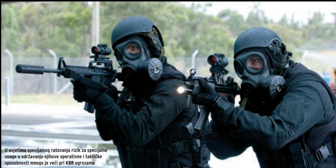
U uvjetima specijalnog ratovanja rizik za specijalne snage u održavanju njihove operativne i taktičke sposobnosti mnogo je veći pri KBR ugrozama

Vojne specijalne snage za svoje operacije rabe sve tri prostorne dimenzije, tj. more, zrak i zemlju, te strategijom posrednog prilaženja onemogućavaju protivniku detaljno planiranje otvorene primjene KBRN oružja i KBR prijetnje napadom na industrijska postrojenja u svrhu sprečavanja takvih operacija. ■ Tekst u cijelosti pročitajte na: www.hrvatski-vojniki.hr