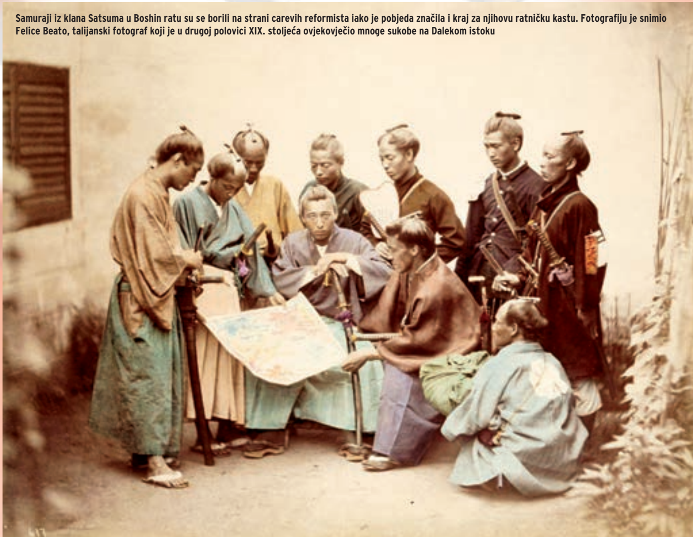
Samuraji iz klana Satsuma u Boshin ratu su se borili na strani carevih reformista iako je pobjeda značila i kraj za njihovu ratničku kastu. Fotografiju je snimio Felice Beato, talijanski fotograf koji je u drugoj polovici XIX. stoljeća objektivno snimio mnoge sukobe na Dalekom istoku

Pod utjecajem naglog razvoja proizvodnih snaga, krajem XIX. i početkom XX. stoljeća, Japan se ubrzano razvijao u prvorazrednu imperijalističku silu. Orijentirao se na ekspanziju na azijsko kopno, u prvom redu na Korejski poluotok i Kinu, da bi zadovoljio svoje potrebe za izvorima sirovina i novim tržištima. No, to je razdoblje sada već dio novije japanske povijesti. U njoj su Bushido kodeks i samurajska tradicija postali samo sredstvo manipulacije u rukama potpuno militariziranog vojno-državnog čelništva. Pomoću njega željeli su realizirati svoje vanjsko-političke apetite nizom ratova. Sve je započelo s I. japansko-kineskim ratom 1894. – 1895., a završilo na krstarici Missouri 1945., kada je japanski militarizam definitivno slomljen. (kraj) ■