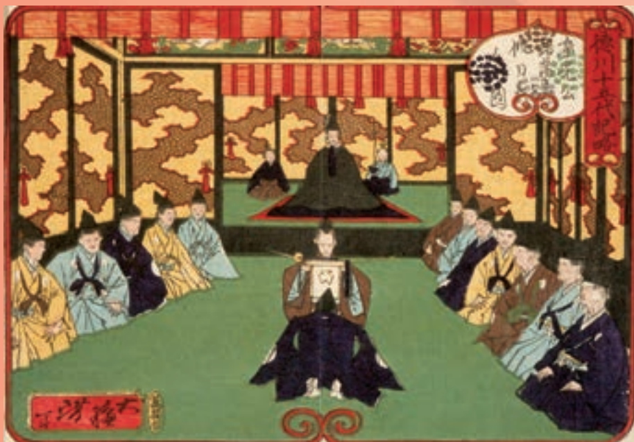
Tokugawa Iyemitsu (gore na slici) slomio je orušanu pobunu japanskih kršćana i gotovo potpuno izolirao Carstvo od stranaca. Slika je nastala 1875. i djelo je Tsukiokie Yoshitoshija