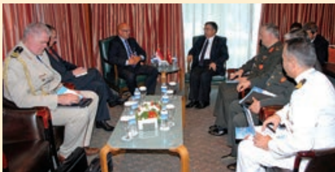
Državni tajnik Šimunović se na marginama sastanka zemalja članica SEDM inicijative sastao s ministrom nacionalne obrane Republike Turske, Ismetom Yilmazom

U svom obraćanju državni tajnik Šimunović iskazao je snažnu potporu daljnjem radu i razvoju SEDM-a kao važnog i uspješnog regionalnog foruma koji pridonosi jačanju mira, sigurnosti i stabilnosti u jugoistočnoj Europi, te daje konstruktivan prilog razvoju međusobnog povjerenja i razumijevanja u svrhu što bržeg uključivanja zemalja regije u euroatlantske integracije. Istaknuo je da će RH i dalje aktivno pridonositi razvoju SEDM procesa sudjelovanjem u njegovim projektima u skladu s vlastitim mogućnostima i kapacitetima. SEDM je inicijativa čiji je cilj jačanje suradnje država jugoistočne Europe, te Italije i SAD-a na području obrane u duhu Partnerstva za mir, u svrhu što bržeg uključivanja zemalja jugoistočne Europe u transatlantske integracije, poglavito NATO. Članice SEDM inicijative obvezuju se na promicanje dobrosusjedskih odnosa, kao i na konstruktivnu obrambenu i sigurnosnu suradnju u regiji.