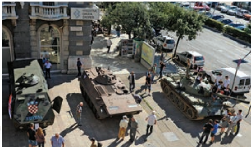
Izložbu je na poticaj braniteljskih udruga organizirao Grad Rijeka i Primorsko-goranska županija u suradnji s MORH-om, a otvorio ju je ministar obrane Davor Božinović

proizvedeni u Rijeci, a upotrebljavale su ih postrojbe s područja Primorsko-goranske županije. Izložbu je na poticaj braniteljskih udruga organizirao Grad Rijeka i Primorsko-goranska županija u suradnji s MORH-om, a postavljena je u povodu dvadeset godina hrvatske neovisnosti i dvadesete obljetnice ustrojavanja Zbornog područja Rijeka. Ministar Božinović kazao je da mu je čast sudjelovati u proslavi u kojoj Rijeka obilježava 20. obljetnicu osnutka operativne zone i dana u kojima su Riječani ispisivali stranice obrane Hrvatske. Govoreći o oružju tada proizvedenu u Rijeci, rekao je da je to bio proizvod riječke pameti i industrije, te dodao da svim braniteljima, kao i riječkim braniteljima koji su dali svoj doprinos, pretežno na ličkoj bojišnici, odaje priznanje, a žrtvama iskazuje pijetet. Istaknuo je da hrvatske OS danas imaju novu tehniku, koja je također rezultat domaće pameti, te da je hrvatski vojnik od čizme do kacige opremljen hrvatskim proizvo-