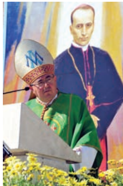
Svečanu euharistijsku službu u crkvi na otvorenom predvodio je vrhbosanski nadbiskup kardinal Vinko Puljić

Govoreći da i papa Benedikt XVI. često ističe da Crkva mora biti hrabra u navještanju radosne vijesti kardinal Puljić je okupljene vojnike i policajce, kao i sve vjernike, pozvao da u svom poslanju