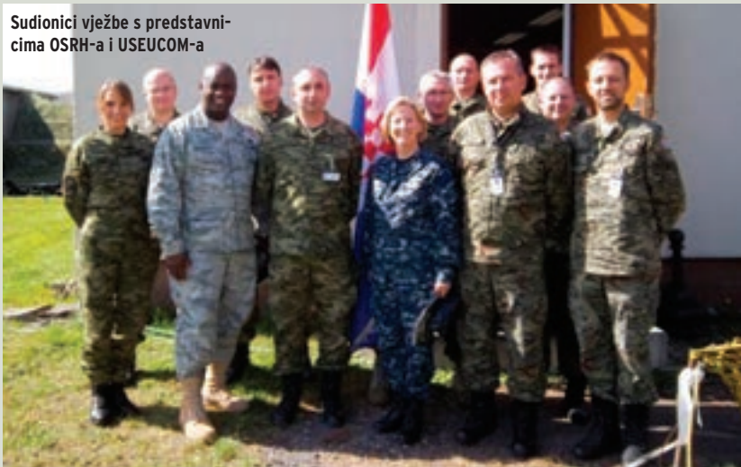
Sudionici vježbe s predstavnicima OSRH-a i USEUCOM-a

činovima sudionika, pa su tako dvojica dočasnika naših Oružanih snaga svojim znanjem dominirali u CJCCC-u nad brojnim časnicima stranih oružanih snaga. Osim što im je vježba Combined Endeavor prilika za učenje, daljnje usavršavanje i njegovanje dugogodišnjih poznanstava stečenih sudjelovanjem na ovoj posebnoj i zanimljivoj vježbi, svojim položajima u CJCCC-u imaju neprocjenjivu ulogu u promociji OSRH-a u NATO zajednici, općenito na području komunikacijsko-informacijskih sustava.