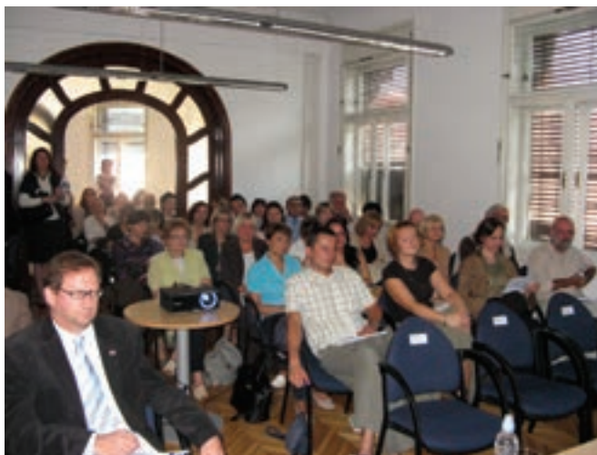
Tribini su osim predstavnika tijela državne uprave, javnih poduzeća i trgovačkih društava nazočili i predstavnici nevladinih udruga

ima, kojima raspolaže ili koje nadziru tijela javne vlasti svim korisnicima bez diskriminacije po bilo kojem temelju. Zakon je donesen u svrhu omogućavanja i osiguranja ostvarivanja prava na pristup informacijama fizičkim i pravnim, domaćim i stranim osobama putem odredbi ovog Zakona. Zakonom su predviđeni i slučajevi u kojima se pristup informacijama ograničava. Tribini su osim predstavnika tijela državne uprave, javnih poduzeća i trgovačkih društava, koji su obveznici postupanja po spomenutom Zakonu, nazočili i predstavnici nevladinih udruga "Gong", "Transparency International Hrvatska" i dr., predstavnici veleposlanstva Ujedinjene Kraljevine Velike Britanije i Sjeverne Irske u Hrvatskoj, Republike Rumunjske te medija. Tom je prigodom Chris Frean iz britanskog veleposlanstva iskazao uvjerenje da će se provedbom ovog Zakona povećati svijest građana o njihovoj ulozi u stvaranju transparentnosti vlasti i većoj razini demokracije. Gošća iz Rumunjske Laura Stefan, kao antikorupcijski stručnjak, iznijela je iskustva Europske unije o provedbi ZPPI-a te na rumunjskom primjeru predstavila sve pozitivne pomake do kojih je došlo pravilnom provedbom Zakona.