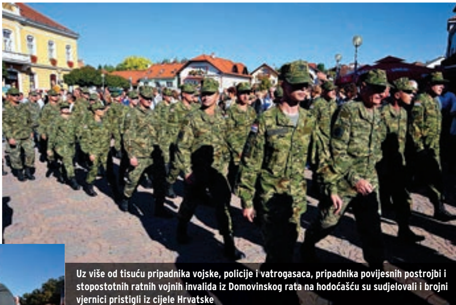
Uz više od tisuću pripadnika vojske, policije i vatrogasaca, pripadnika povijesnih postrojbi i stopostotnih ratnih vojnih invalida iz Domovinskog rata na hodočašću su sudjelovali i brojni vjernici pristigli iz cijele Hrvatske

Da bismo mogli sačuvati vrednote, kulturu i sve ono što je sveto jednom narodu, rekao je kardinal Puljić, moramo prepoznati koje su to vrijednosti. "Čini se da danas kod nas nedostaje dovoljno samokritičnosti u svim strukturama. Jer nisam mjerilo ja, nego je mjerilo Isus Krist prema kojemu uskla-