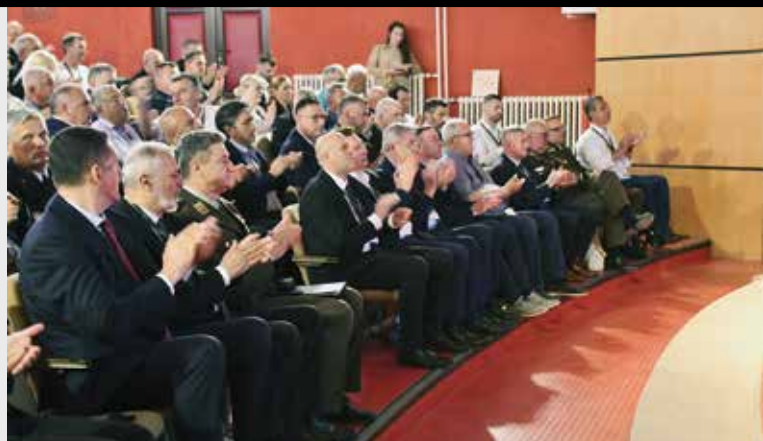
Skup su organizirali Hrvatsko vojno učilište "Dr. Franjo Tuđman" i Sveučilište obrane i sigurnosti "Dr. Franjo Tuđman" u suradnji s nizom hrvatskih i međunarodnih akademskih partnera

Značajan dio programa bio je posvećen političkim i vojnim procesima koji su prethodili Domovinskom ratu. Analizirane su okolnosti raspada Jugoslavije, stvaranja hrvatskih demokratskih institucija, referendum o neovisnosti, razvoja hrvatskih Oružanih snaga te političkih okolnosti koje su prethodile oslobodilačkim operacijama Bljesak i Oluja. Pozornost je nezaobilazno posvećena međunarodnom položaju Hrvatske, ulozi mirovnih snaga Ujedinjenih naroda te strateškim okolnostima koje su dovele do konačnog oslobađanja okupiranih područja.