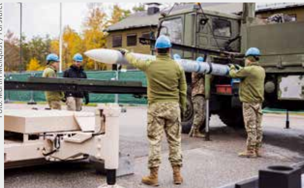
Ukrajinski vojnici na obuci za korištenje NASAMS-a koje je Norveška donirala njihovoj zemlji